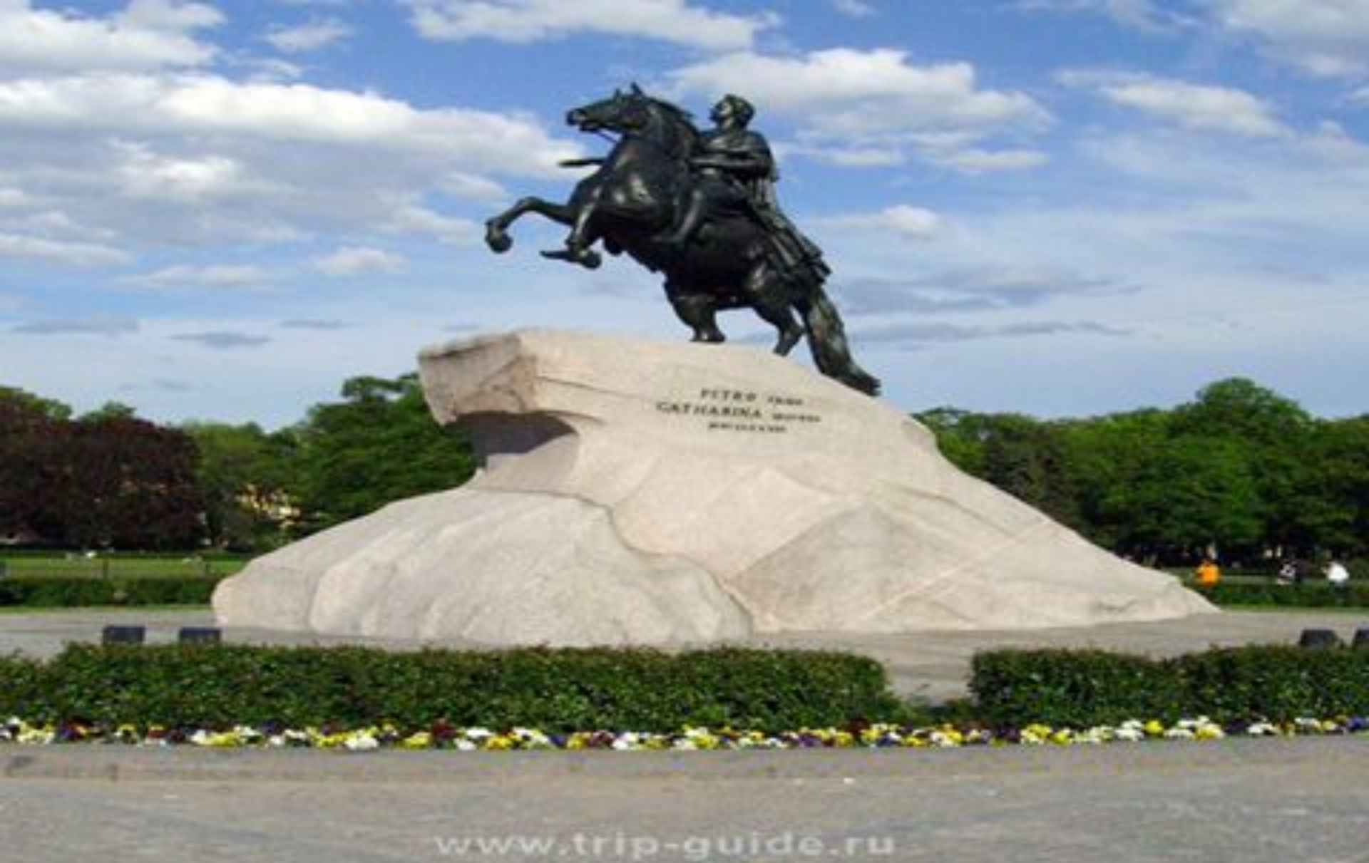
2. Город Санкт-Петербург, памятник «Медный всадник»