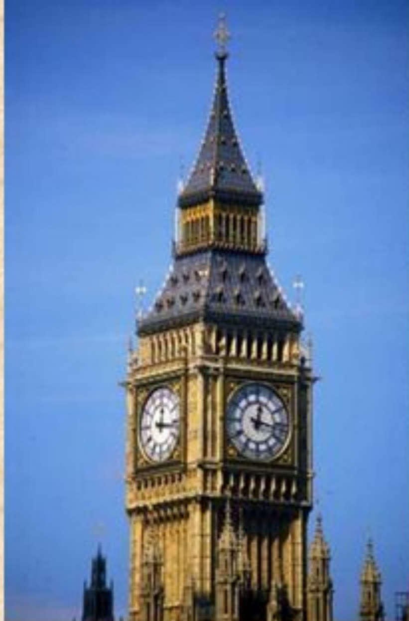
3. Город Лондон, Биг-бен.