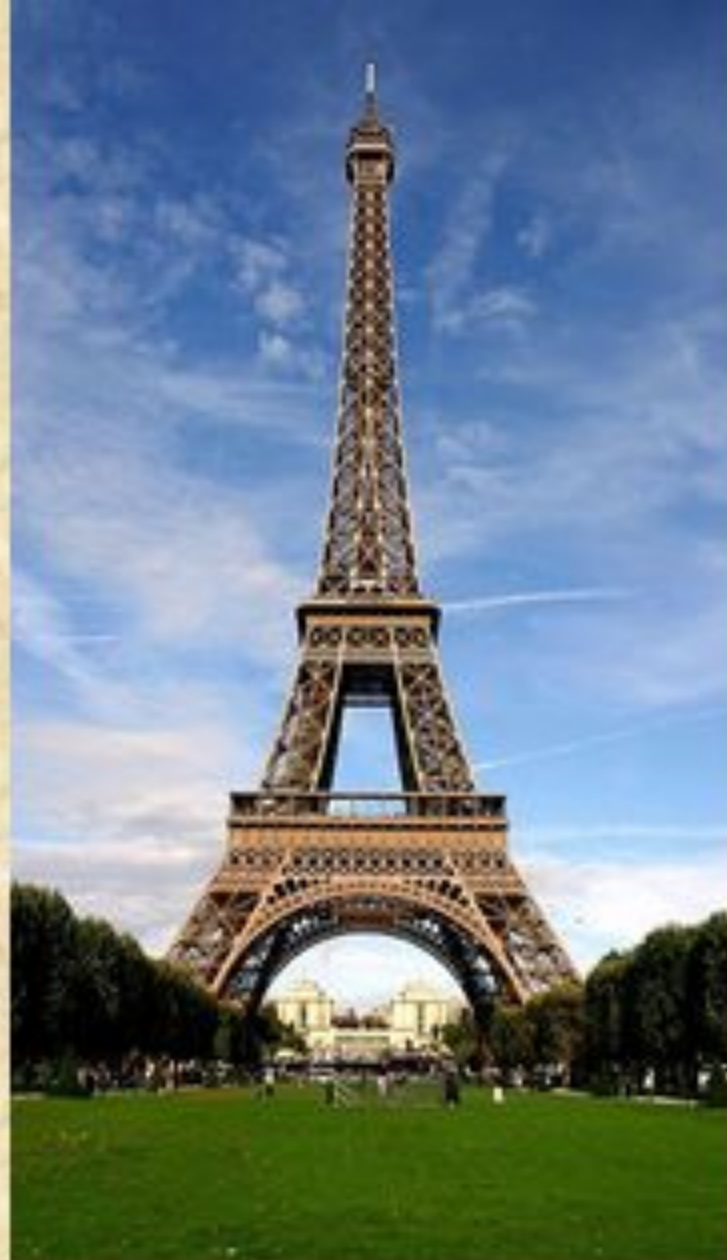
4. Город Париж, Эйфелева башня.