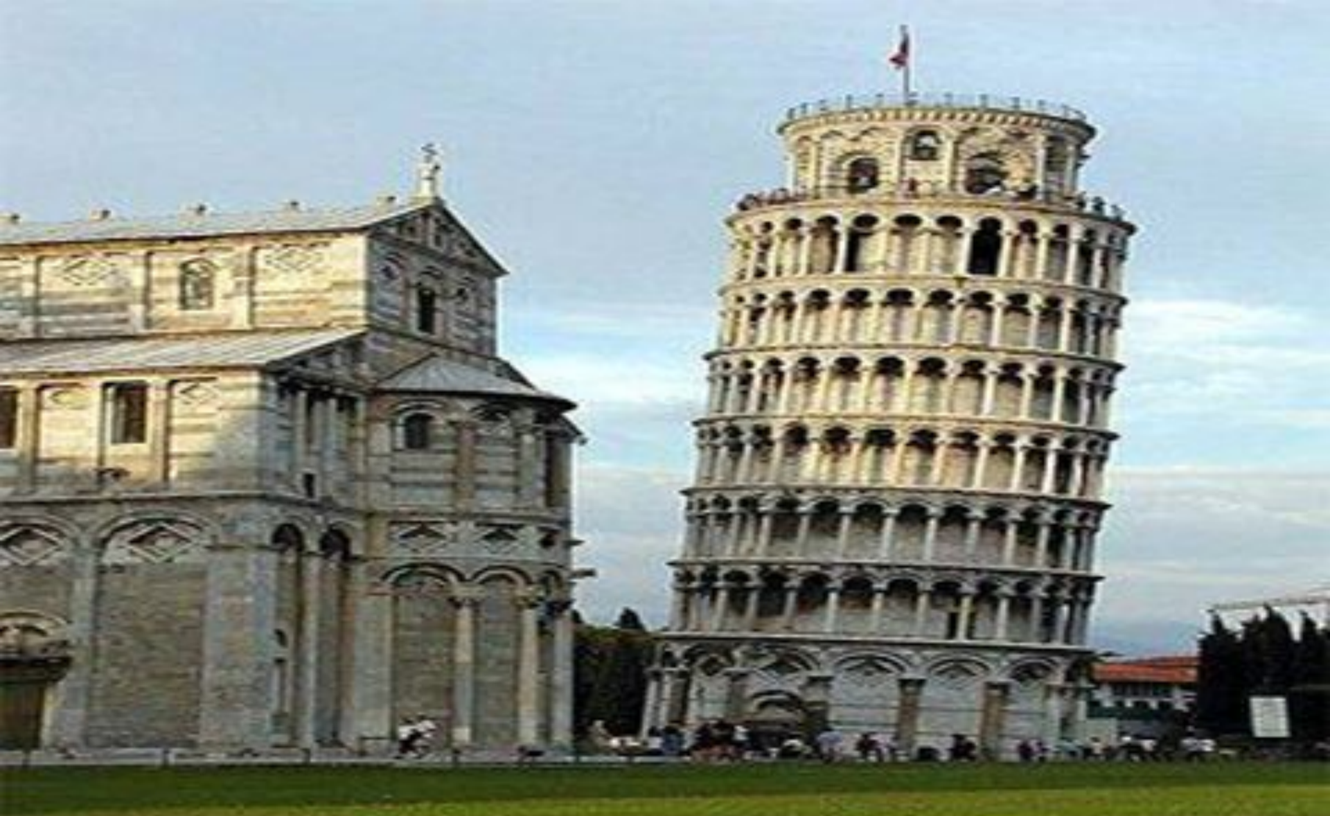
5. Город Пиза, Пизанская башня.