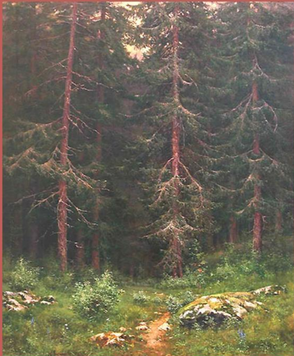
Е. Кузнецов «Берендеево царство»