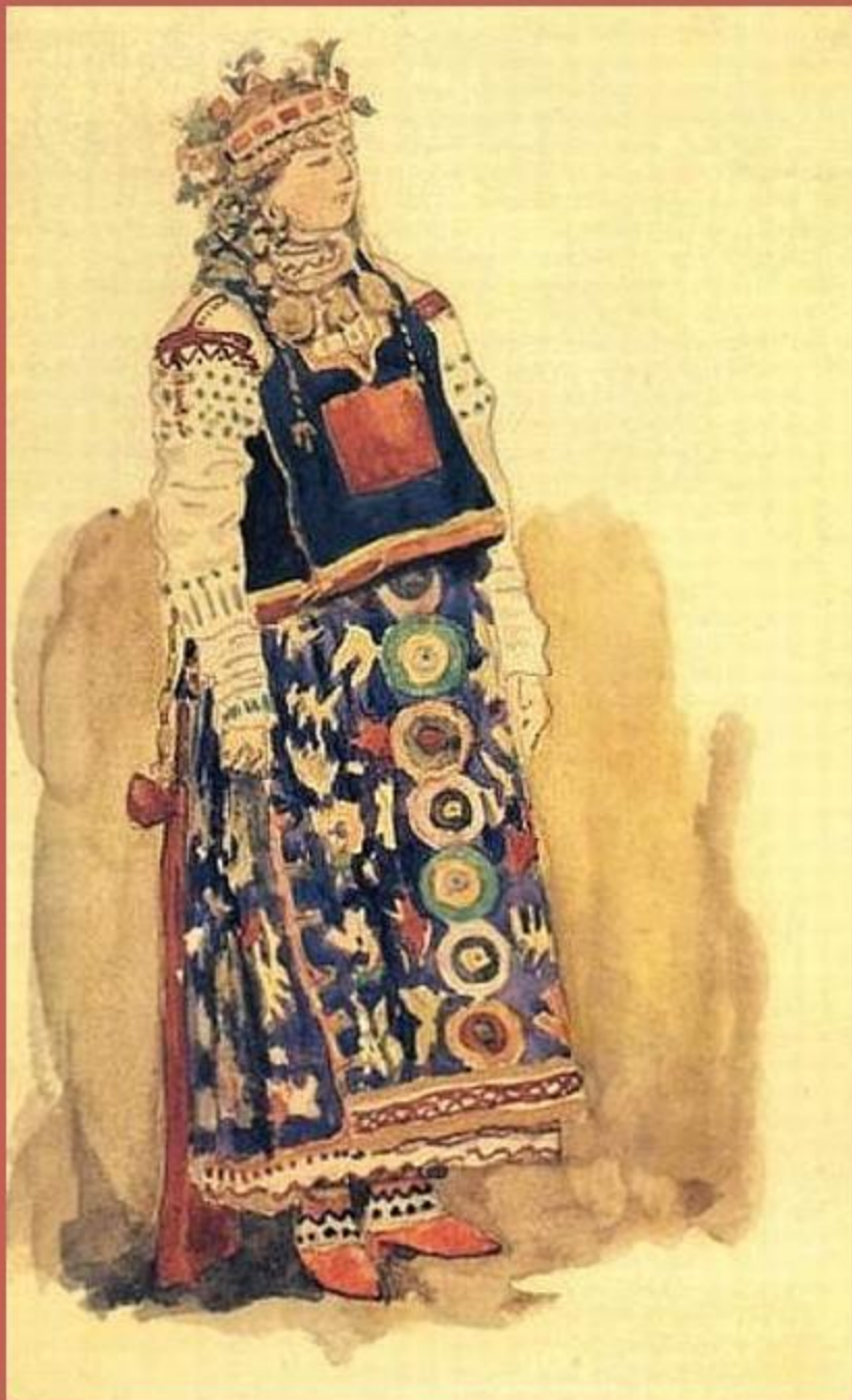
В.М. Васнецов «Купава»