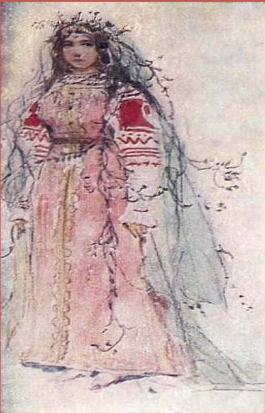
В.М. Васнецов «Весна»