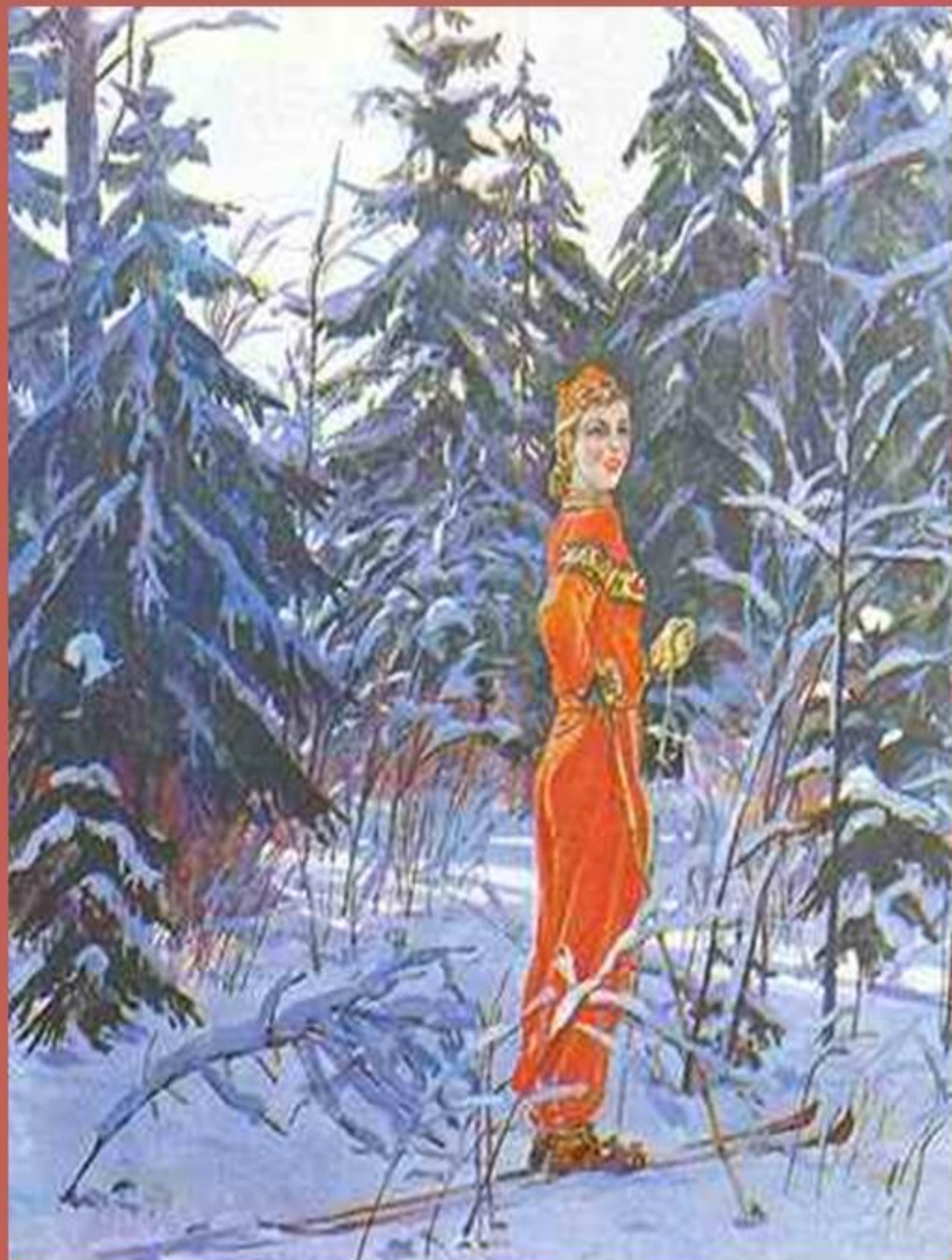
А. Дейнека «Снегурочка»