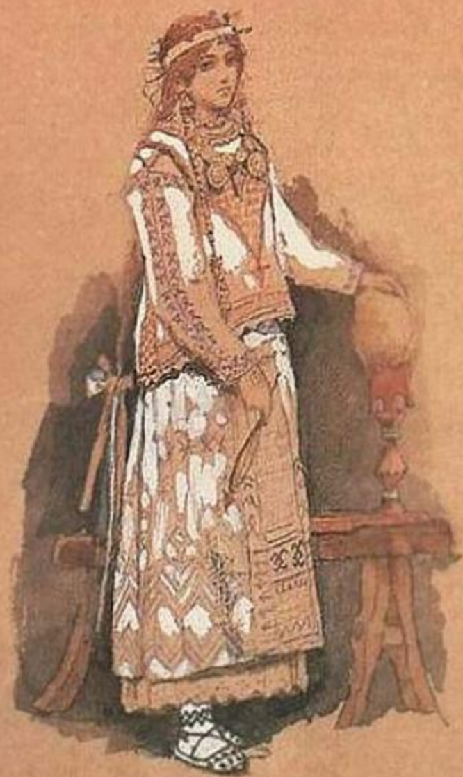
В.М.Васнецов Эскиз костюма Снегурочки