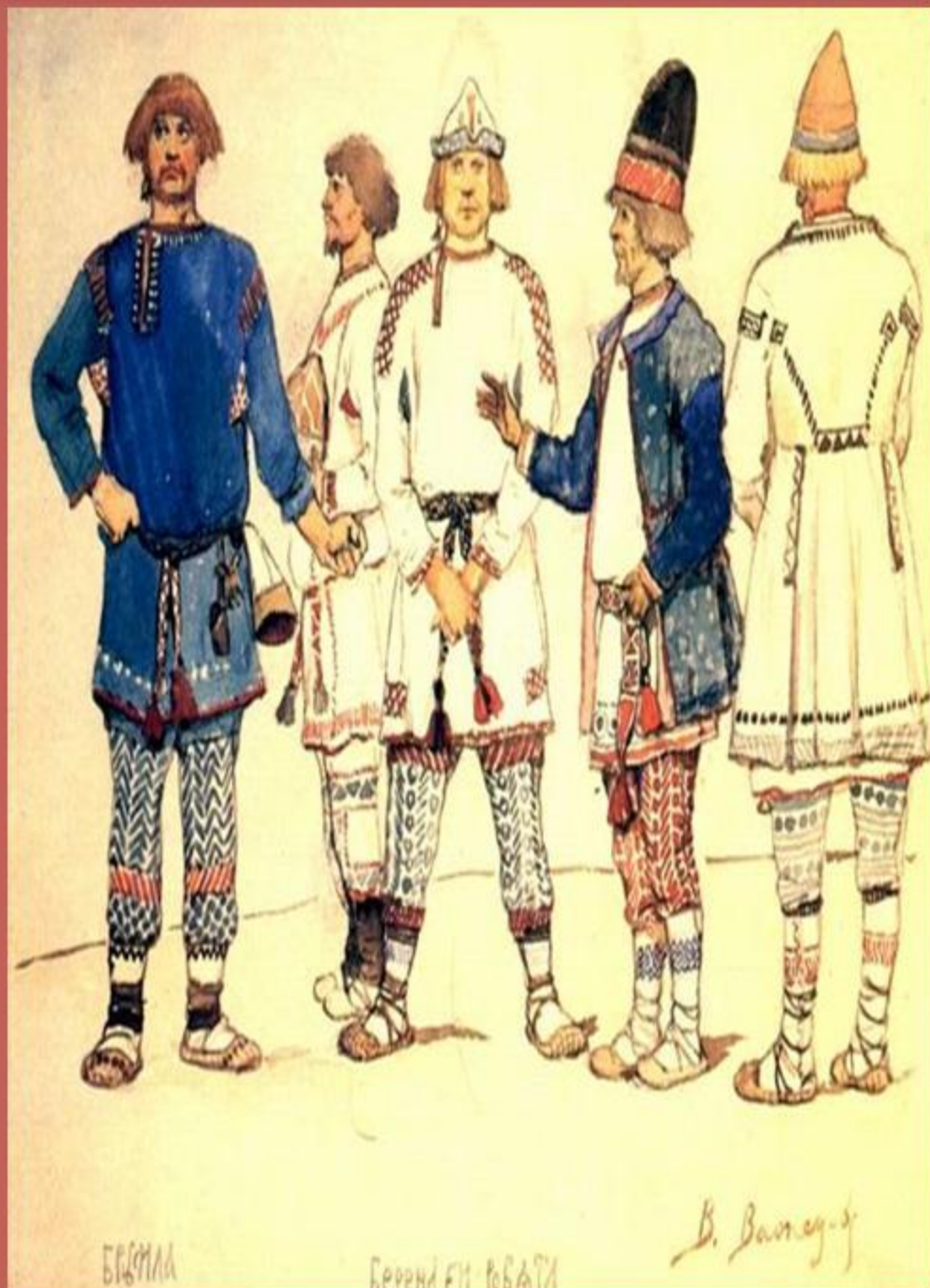
В.М. Васнецов «Берендеи»