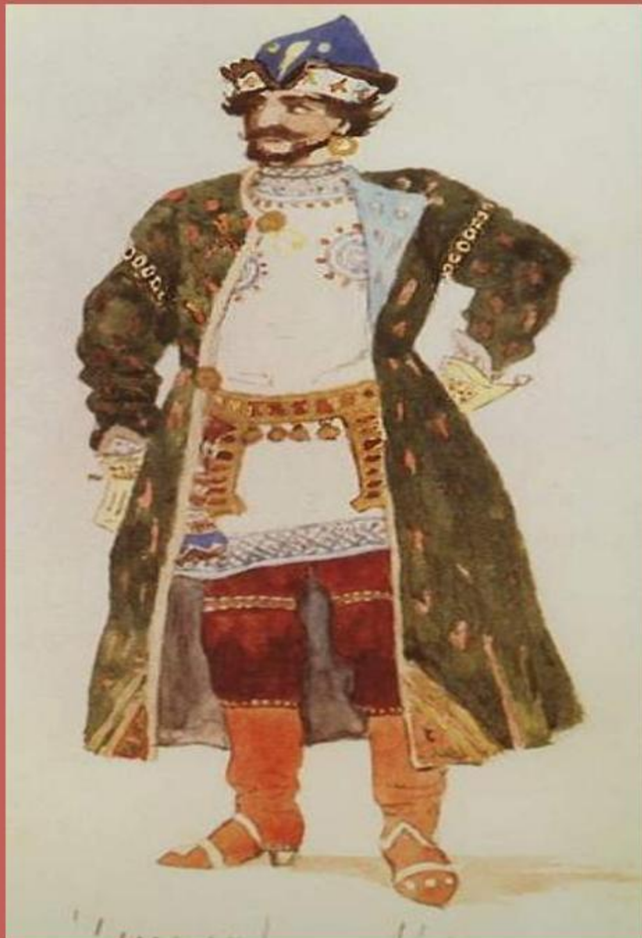
В.М. Васнецов «Мизгирь»