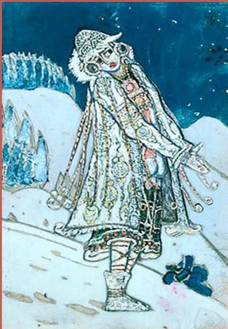
Н.Рерих. Костюм Снегурочки