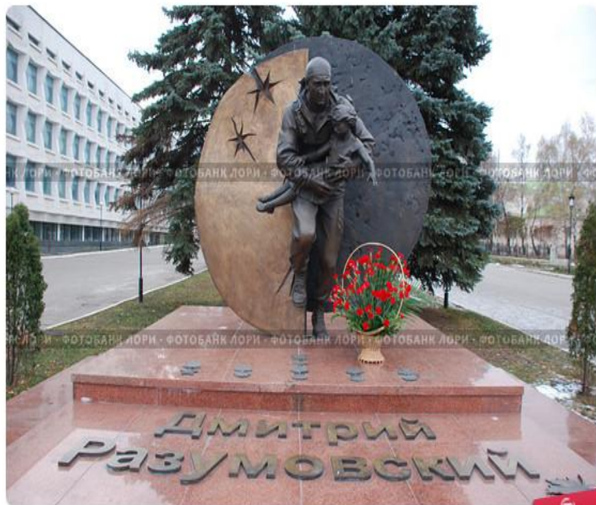
Памятник спецназовцу. Ульяновск.