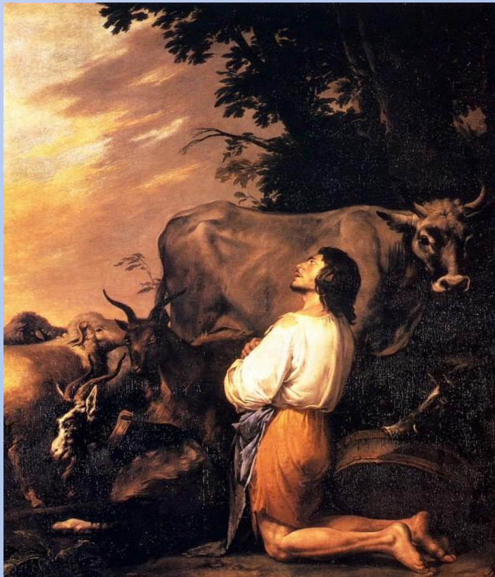
Сальватор Роза .Блудный сын.17 век