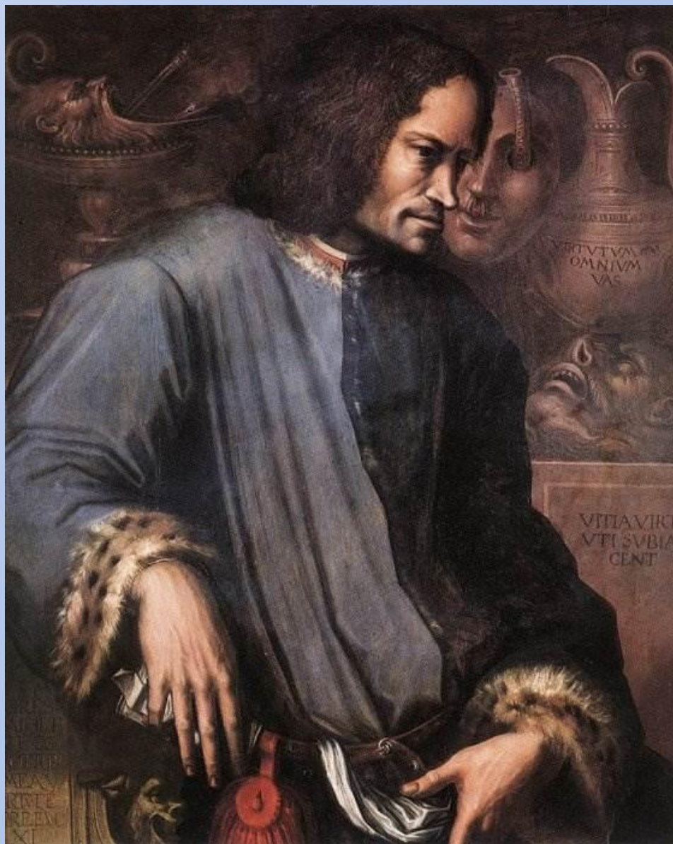
Портрет Лоренцо ди Пьеро де Медичи (Великолепного). Джорджо Вазари