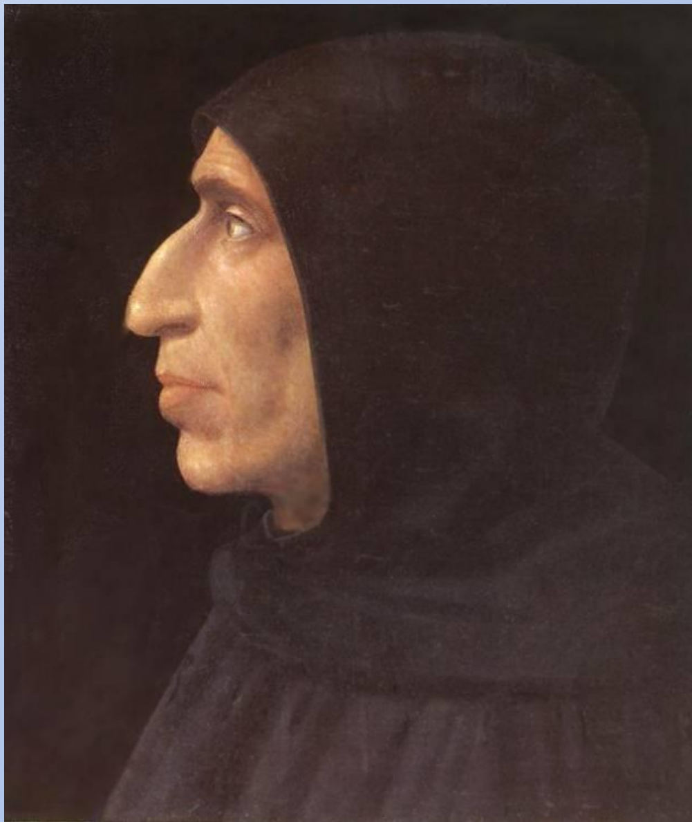
Бартоломео Фра. Портрет Савонаролы