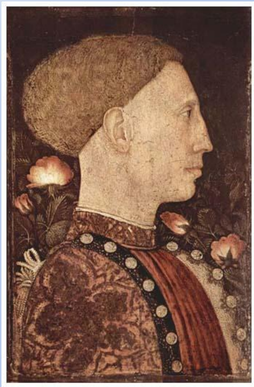
Пизанелло Портрет Лионелло д'Эсте. Бергамо. Галерея Академи Каррара. Италия.