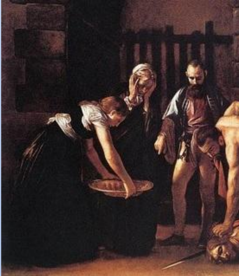
Усекновение головы Иоанна Предтечи. Караваджо. Фрагмент