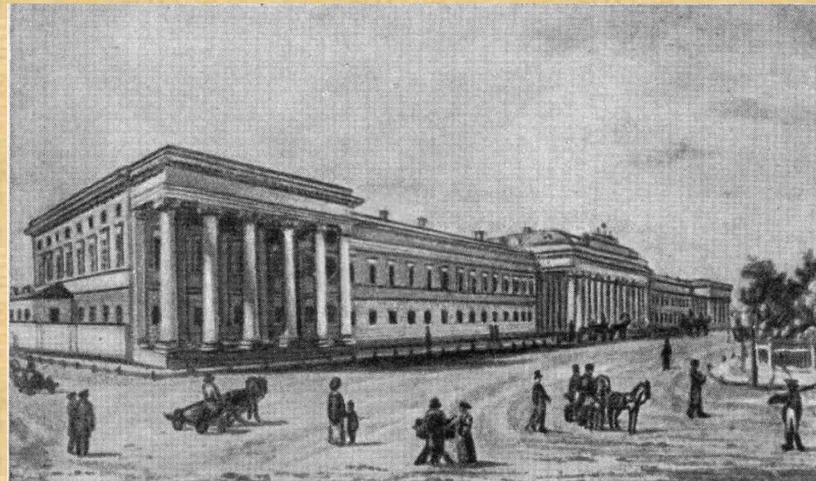
Казанский университет в середине XIX века.