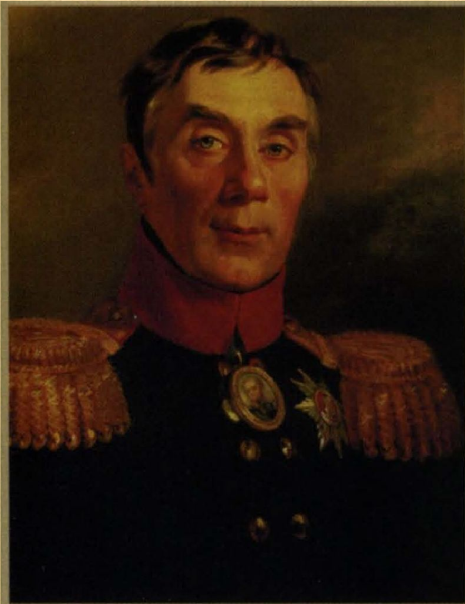
Аракчеев Александр Андреевич (1769–1834) генерал от артиллерии, граф