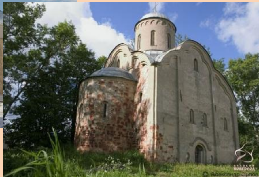
Церковь Петра и Павла на Славне. XIV век.