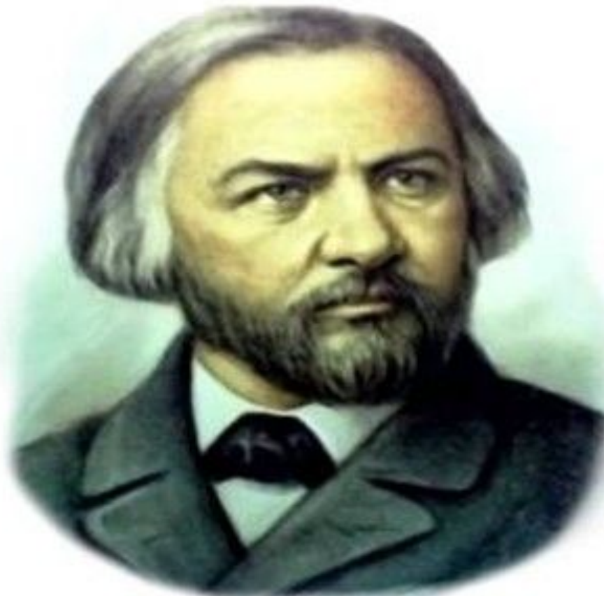
Михаил Иванович Глинка

Большим мастером русского классического романса был М. Глинка