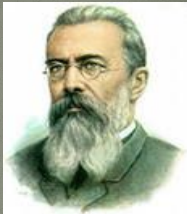
Никола́й Андре́евич Ри́мский-Ко́рсаков (1844 —1908)