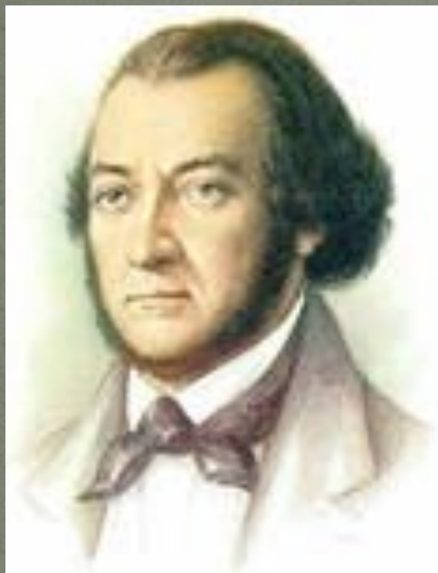
Алекса́ндр Алекса́ндрович Аля́бьев (1787 — 1851)