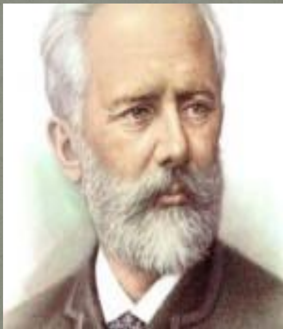
Пётр Ильи́ч Чайко́вский (1840- 1893)