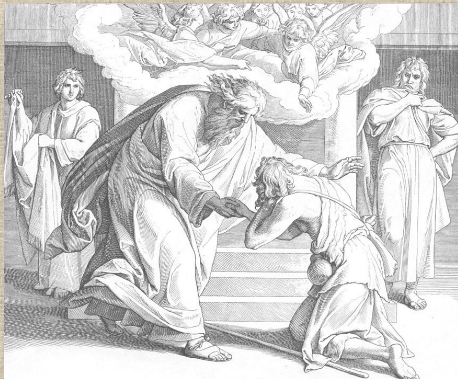
Юлиус фон Шнорр Карельсфельд «Притча о блудном сыне».