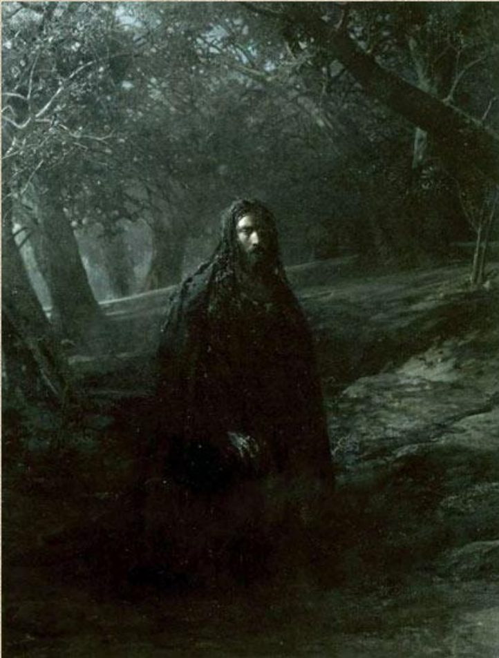
Николай Николаевич Ге «В Гефсиманском саду»