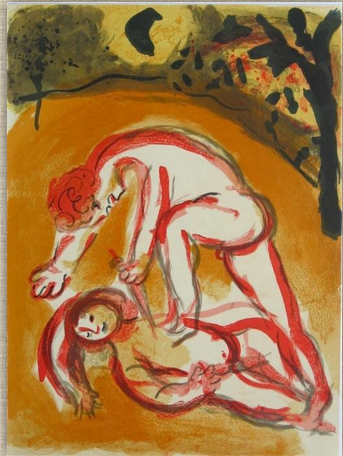
М.Шагал «Каин и Авель»