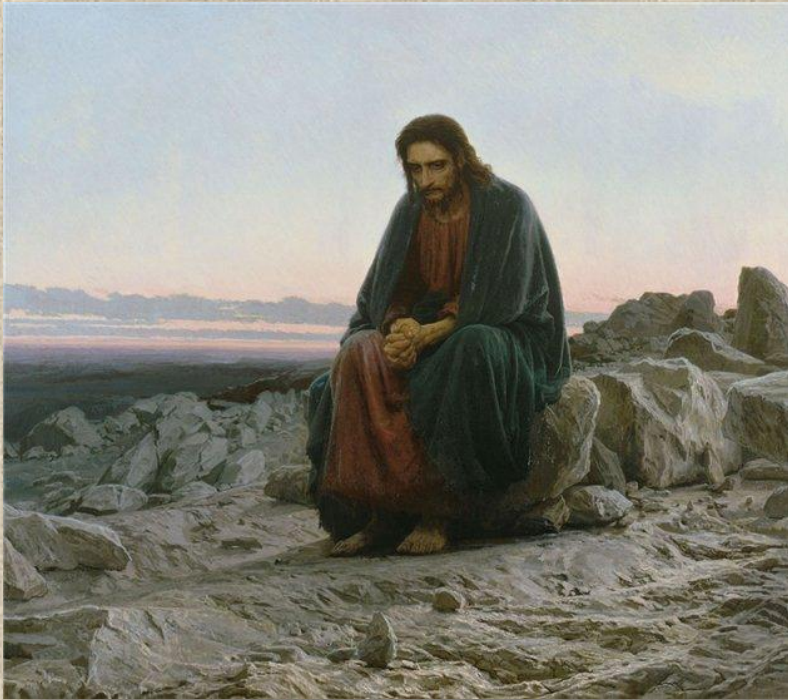
И.Крамской «Христос в пустыне». 1872. Государственная Третьяковская галерея