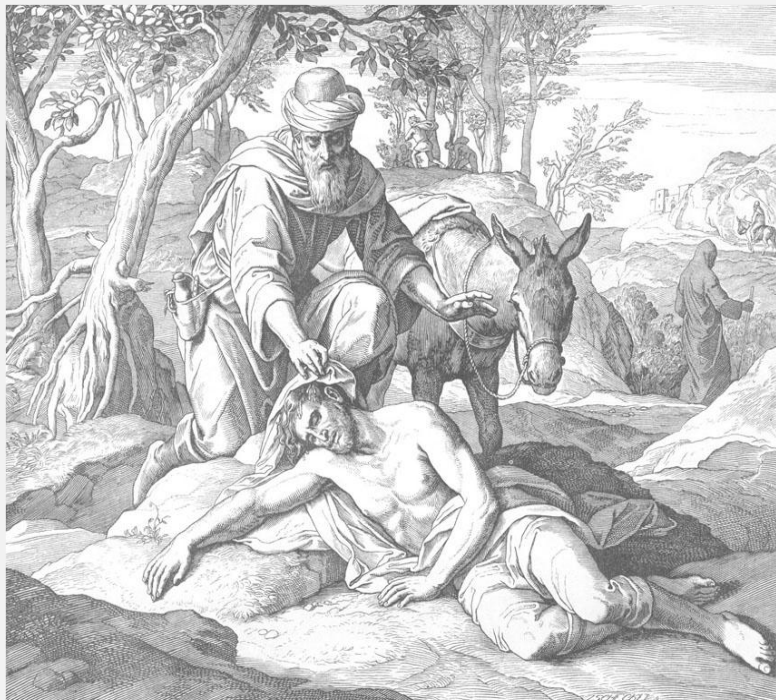
Юлиус Шнорр фон Карольсфельд «Притча о добром самарянине».