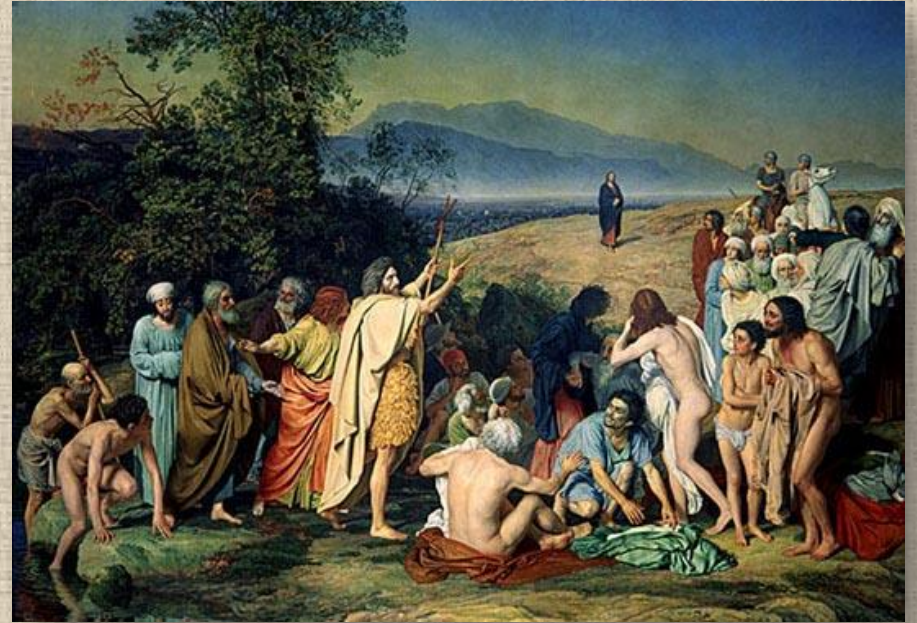
А.Иванов «Явление Христа народу»