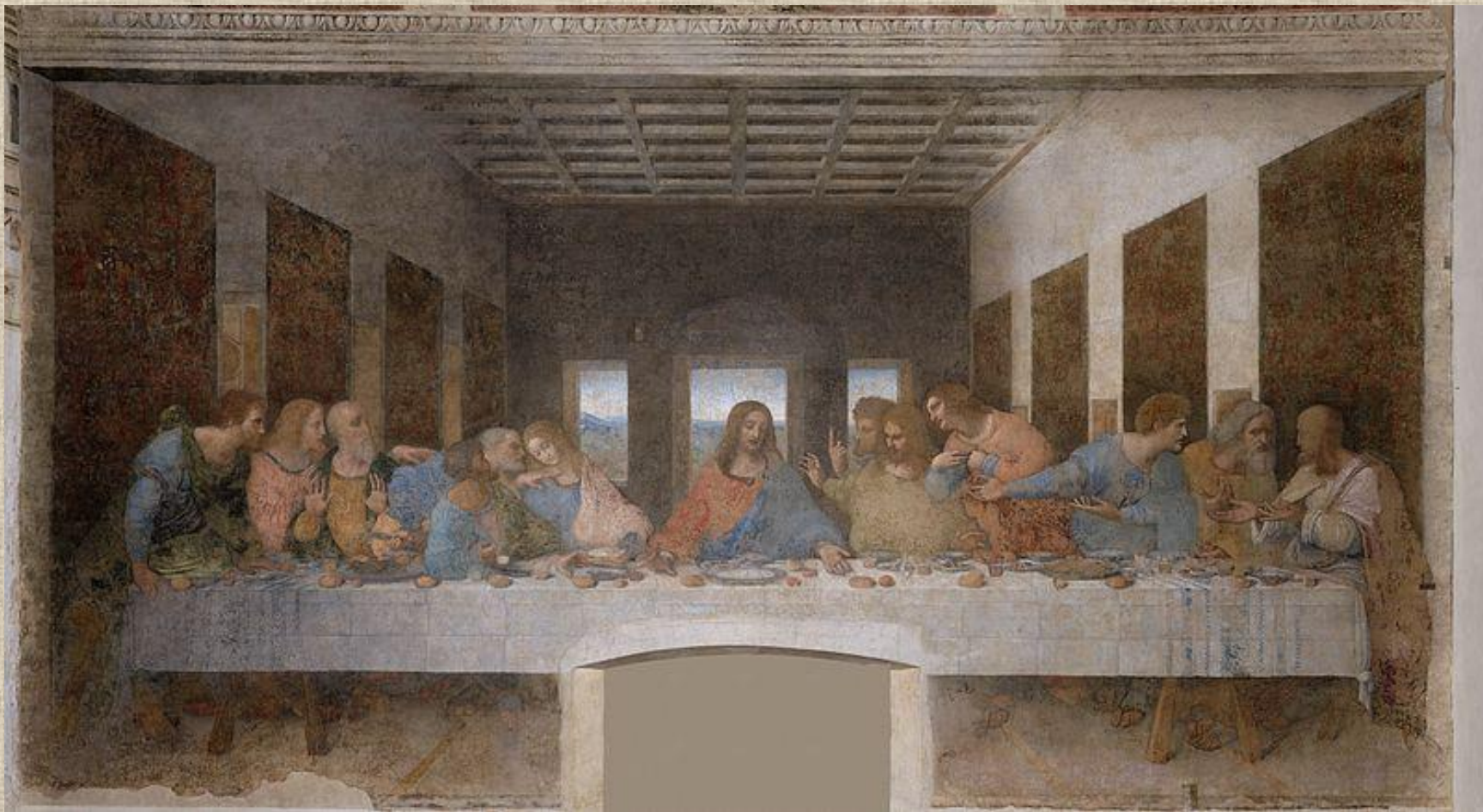
Леонардо да Винчи «Тайная вечеря»