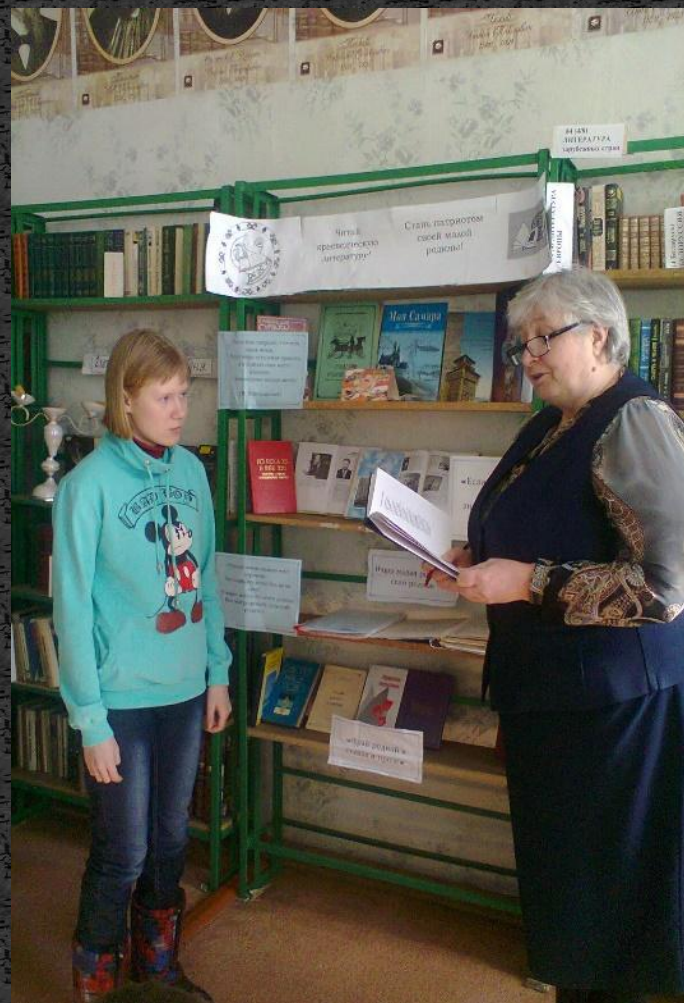
Акция «Всемирный день чтения вслух»