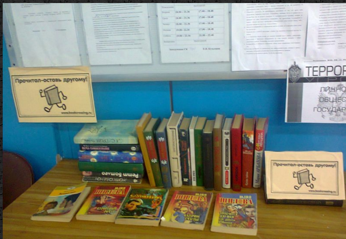
Буккроссинг «Превратим весь мир в библиотеку»- открытая полка в Сельском клубе.