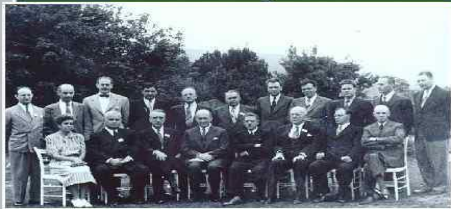
Участники делегаций СССР и США На конференции в Брестон-Вудсоне 1944 г.

В 1944 году в Брестон-Вудсе (США) на конференции ООН представители 44 стран приняли решения: установить фиксированное золотое содержание доллара; был создан МВФ (международный валютный фонд) и МБРР (Международный банк реконструкции и развития)