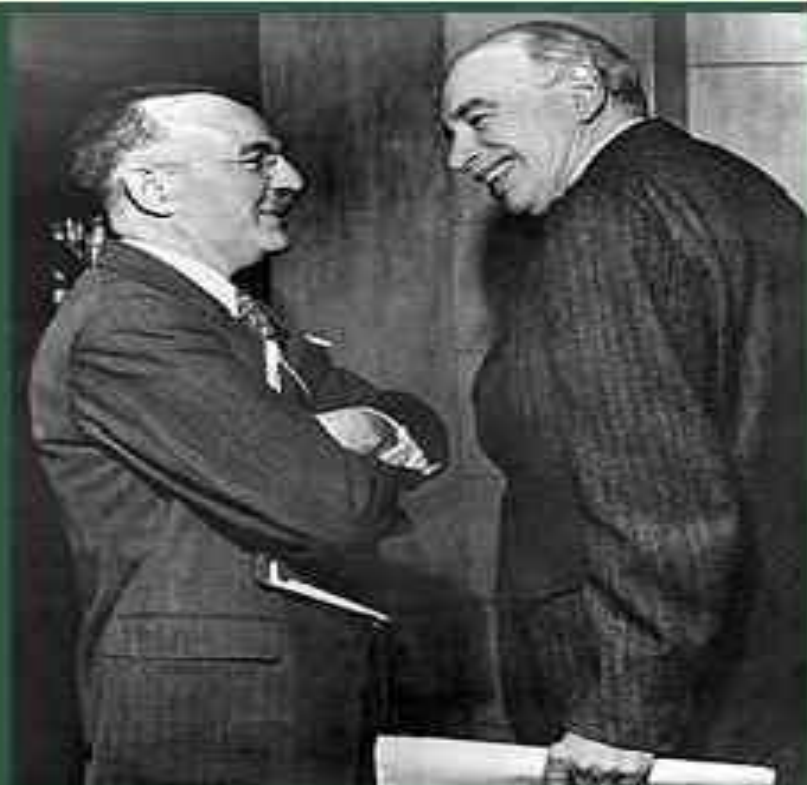
Гарри Декстер Уайт (США) (слева), и Джон Мейнард Кейнс, Великобритания (справа), на Бреттон-Вудской конференции