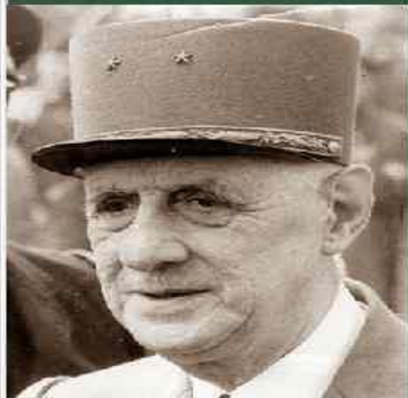
Шарль де Голь