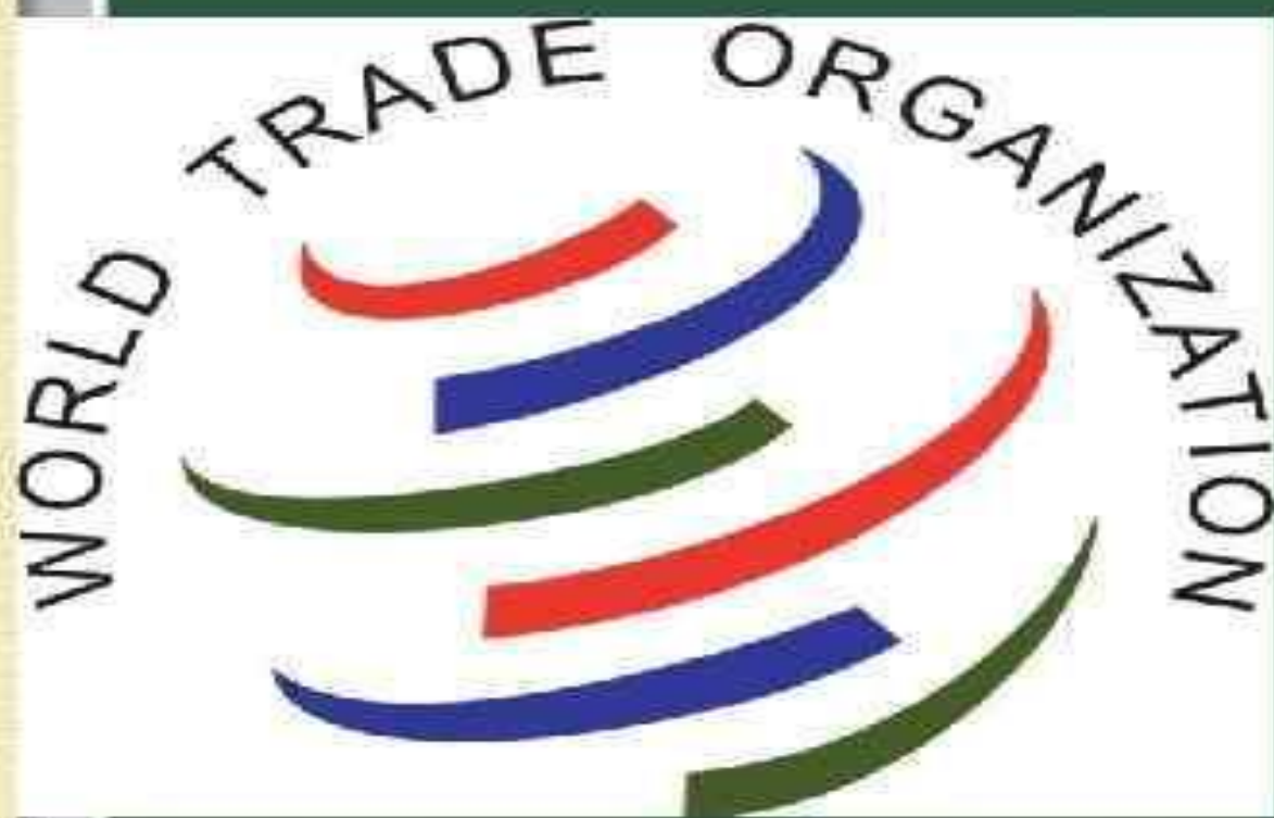
Эмблема Всемирной Торговой организации