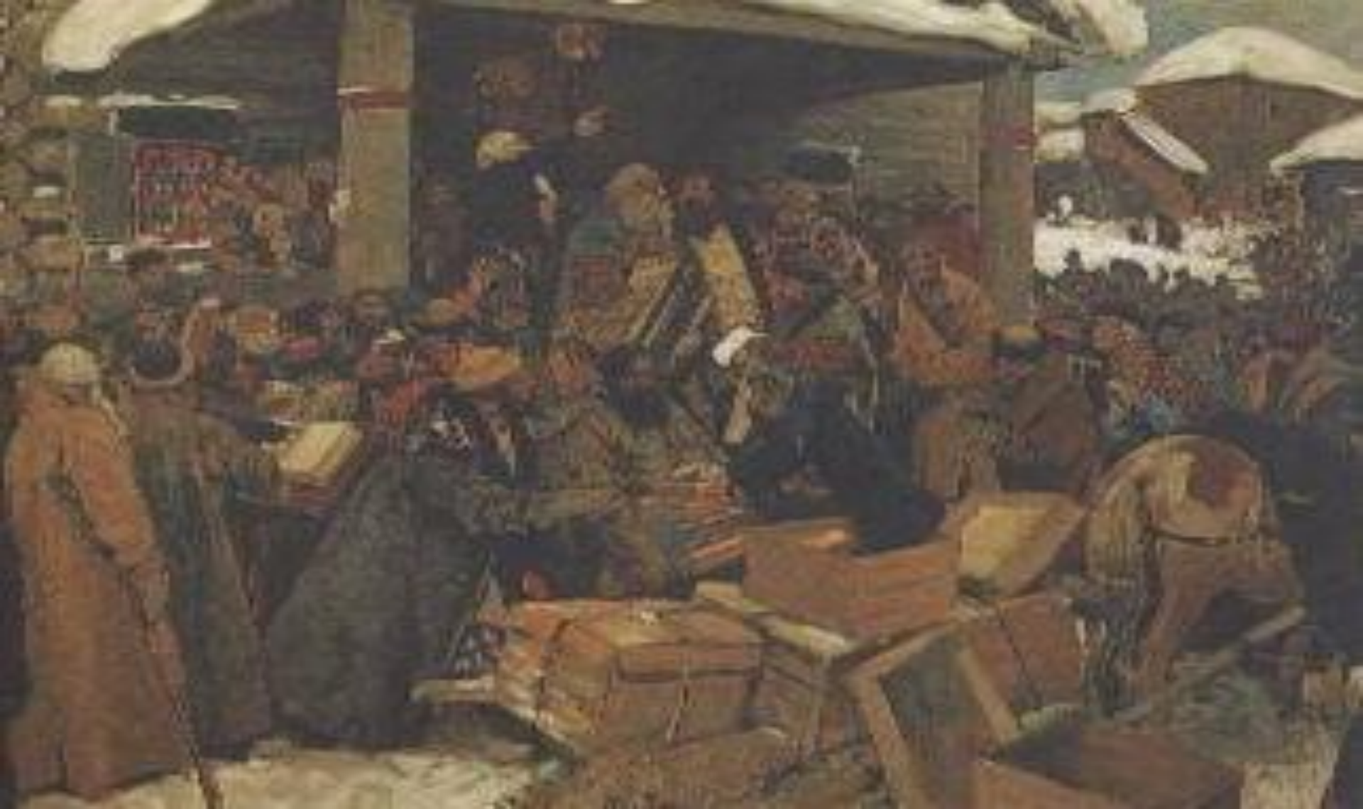
С.В. Иванов «Во времена раскола»