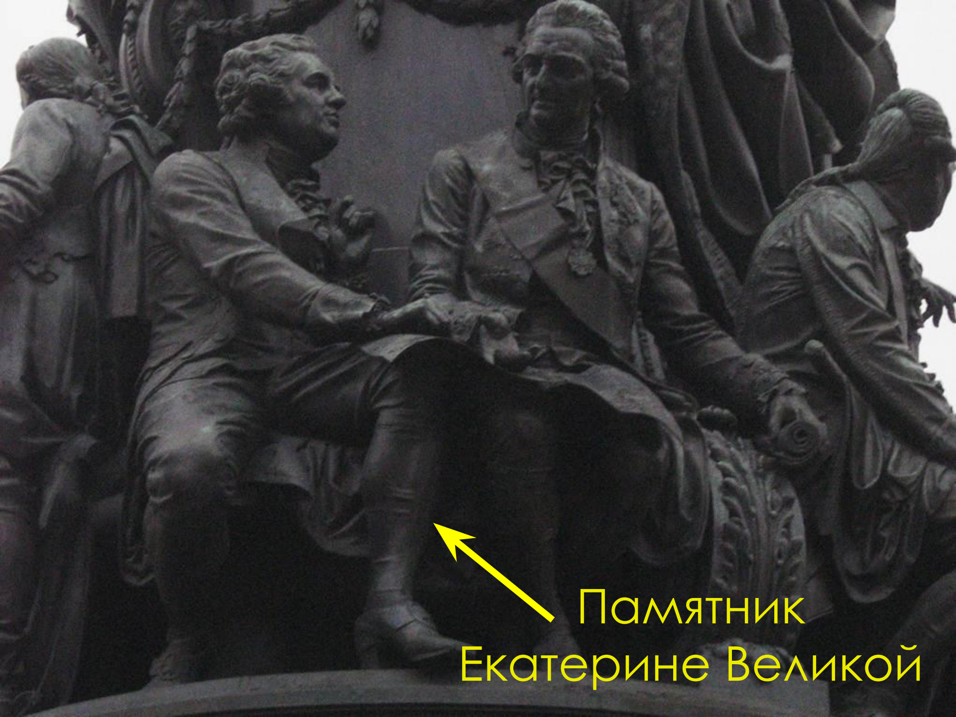
Памятник Екатерине Великой