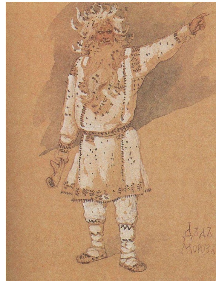
«Дед Мороз», В.М.Васнецов , 1885.