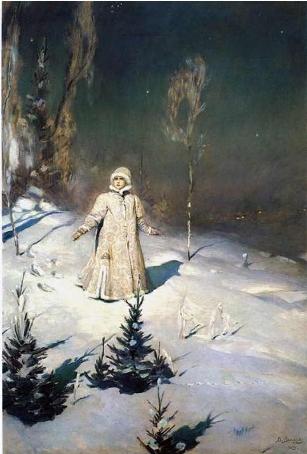
В. М. Васнецов. «Снегурочка», 1899 г.

В 1937 году Дед Мороз и Снегурочка впервые появились вместе на празднике елки в московском Доме Союзов. Она становится его помощницей и посредницей между ним и