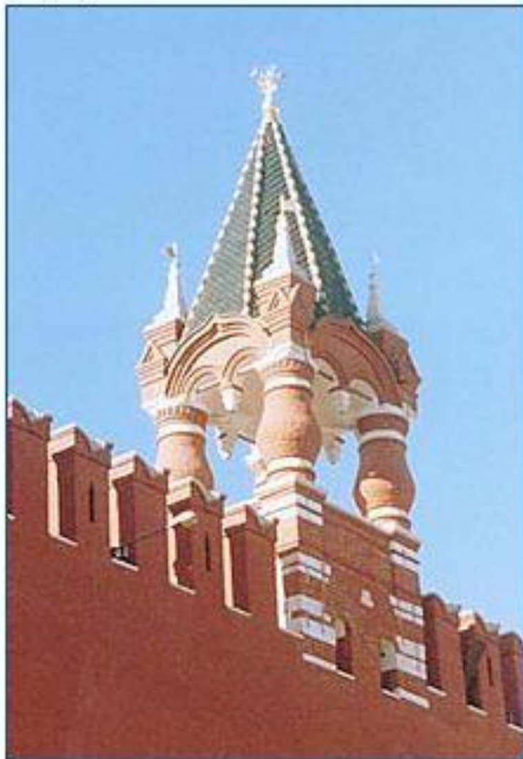
каменный шатер или терем.

Царская башня сооружена в 1680 г. Эта самая молодая и самая маленькая башня Кремля. Она поставлена прямо на стену между Спасской и Набатной. Когда-то здесь была небольшая деревянная башенка, с которой, по легенде, царь Иван Грозный любил наблюдать за событиями, происходившими на Красной площади (отсюда и название башни). Известно, что на ней когда-то размещались колокола кремлевской противопожарной службы — так называемого Спасского набата. Башня хорошо сохранила свои первоначальные формы.