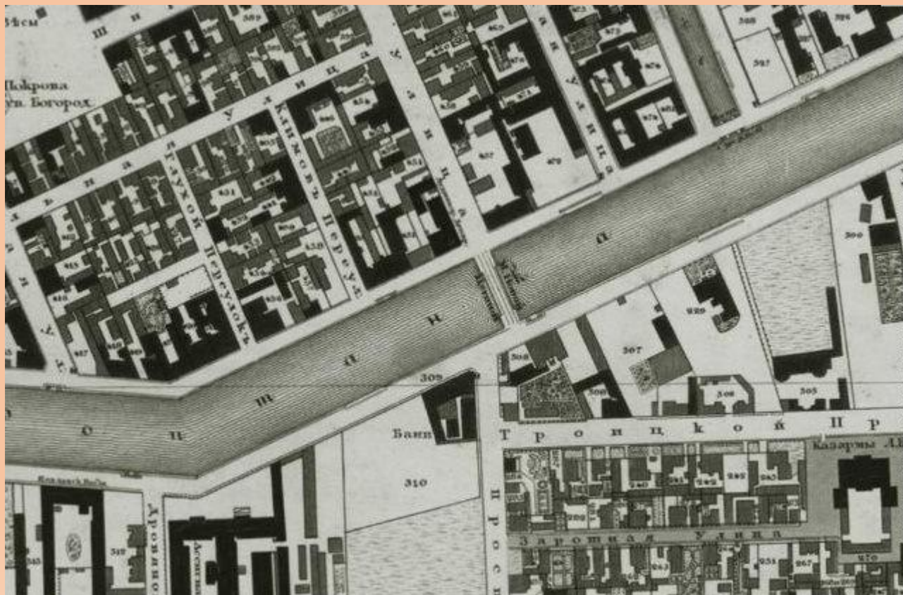
1828 г. План Шуберта

С неоднократно ремонтами мост просуществовал до 1955 г.