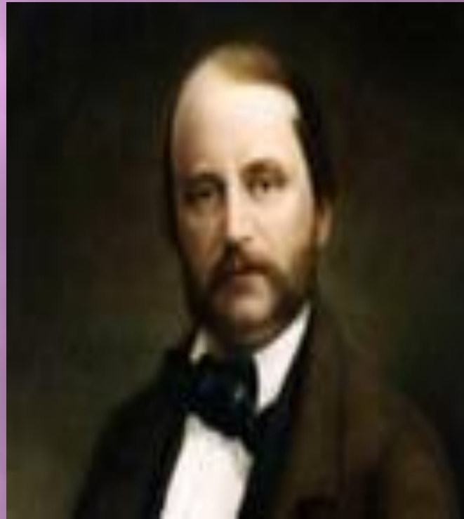
Гончаро в И.А