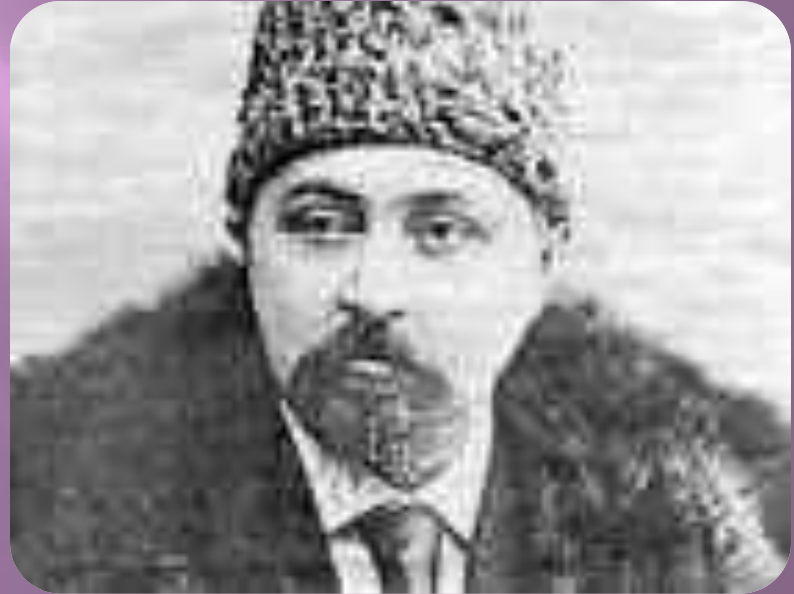
Дмитрий Наркисович Мамин-Сибиряк