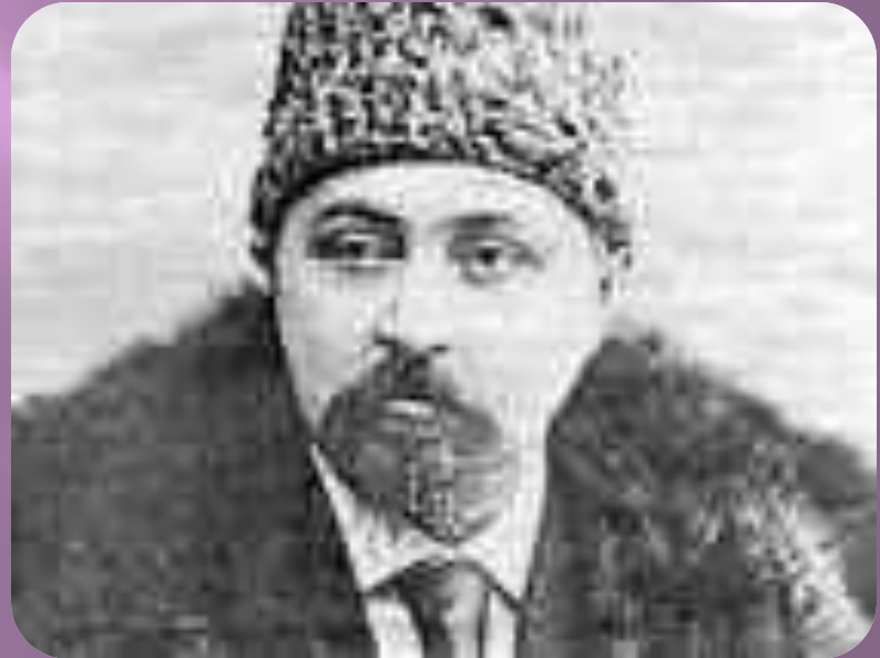
Дмитрий Наркисович Мамин-Сибиряк