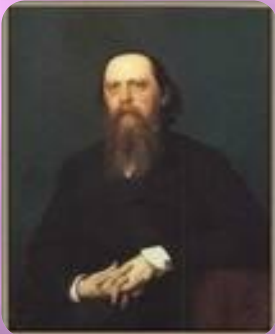
Михаил Евграфович Салтыков-Щедрин