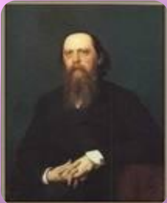
Михаил Евграфович Салтыков-Щедрин