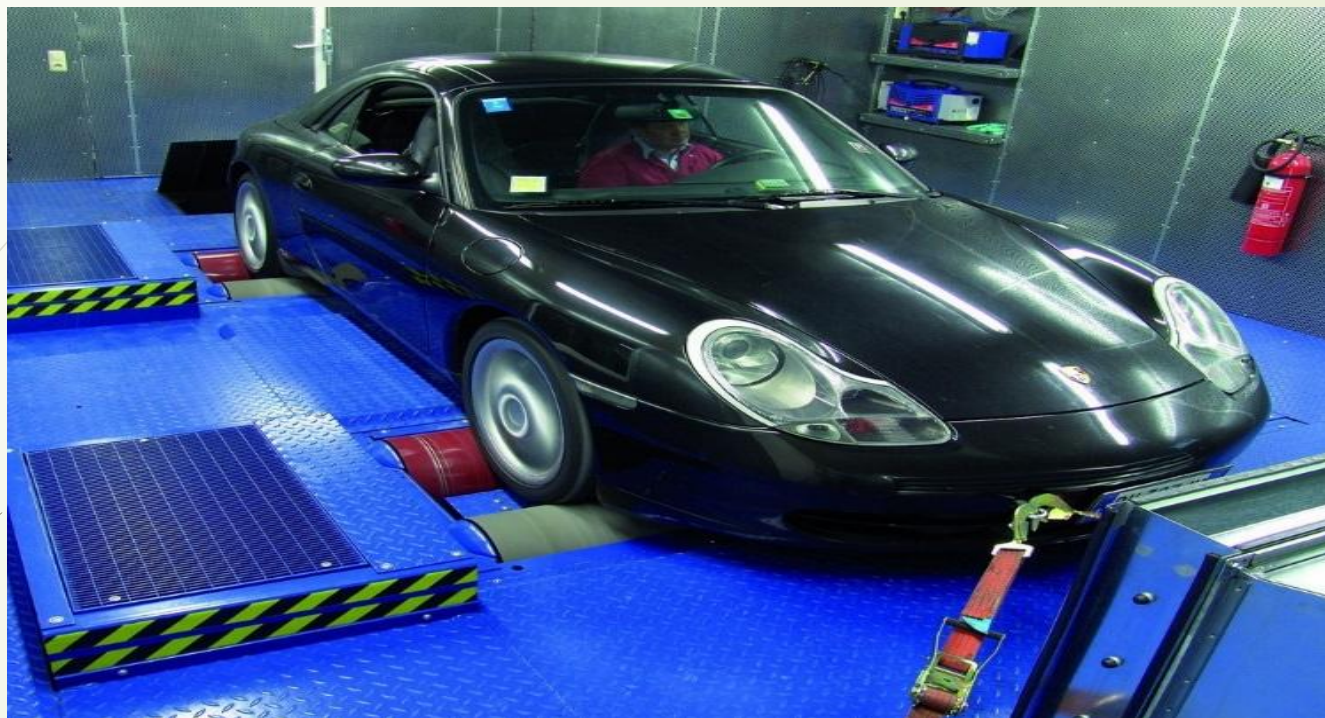
Мощной стенд LPS 3000