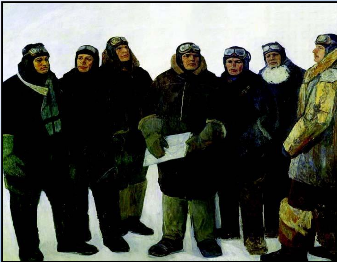
Первые Герои Советского Союза. А.В. Ляпидевский, В.С. Молоков, С.А. Леваневский, М.В. Водопьянов, Н.М. Каманин, И.В. Доронин, М.Т. Слепнев