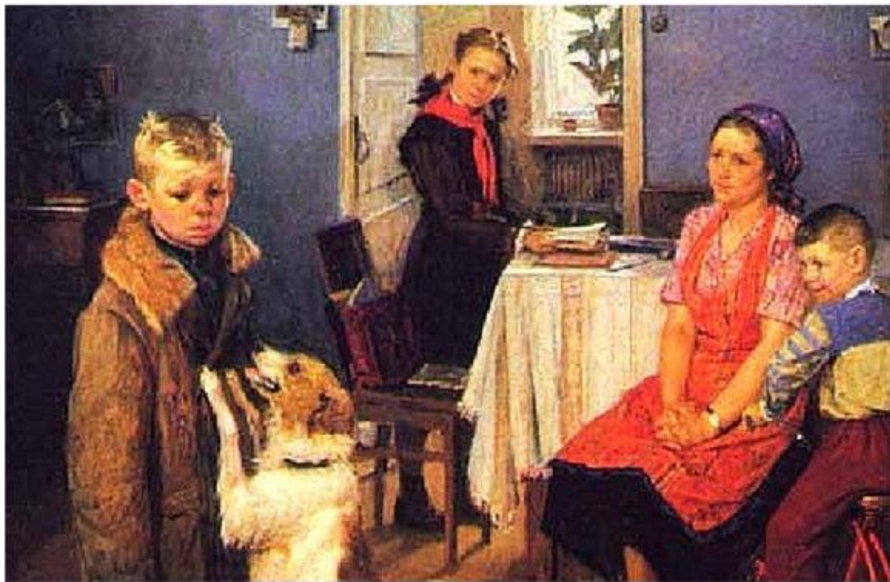
«Опять двойка» 1952 г.