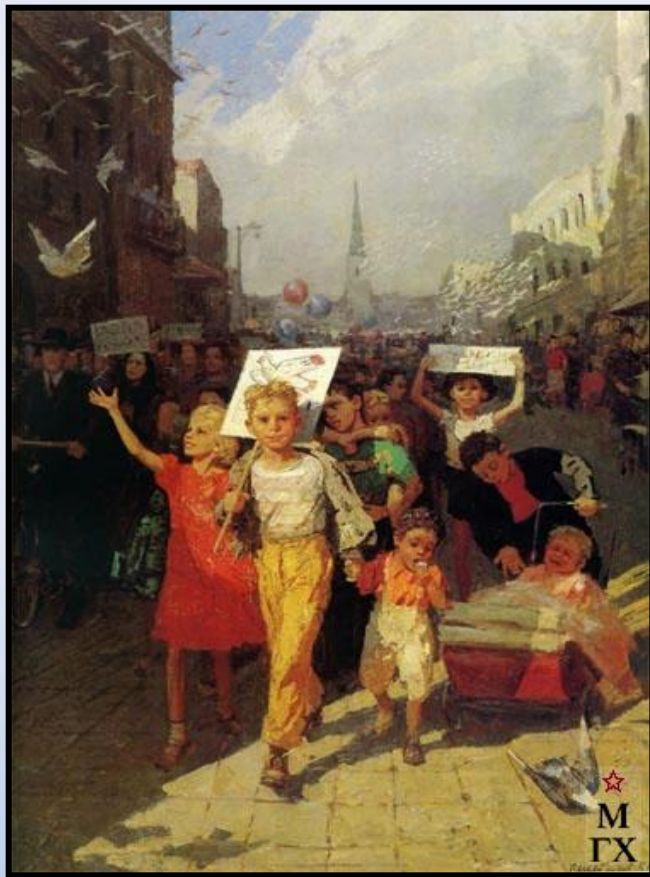
«Голуби мира» 1956