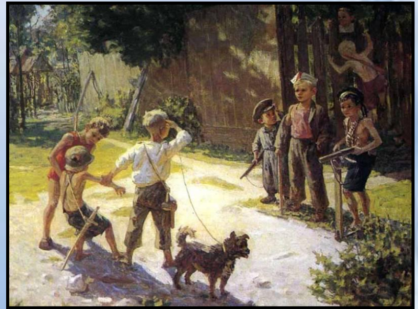
«Достали языка» 1943