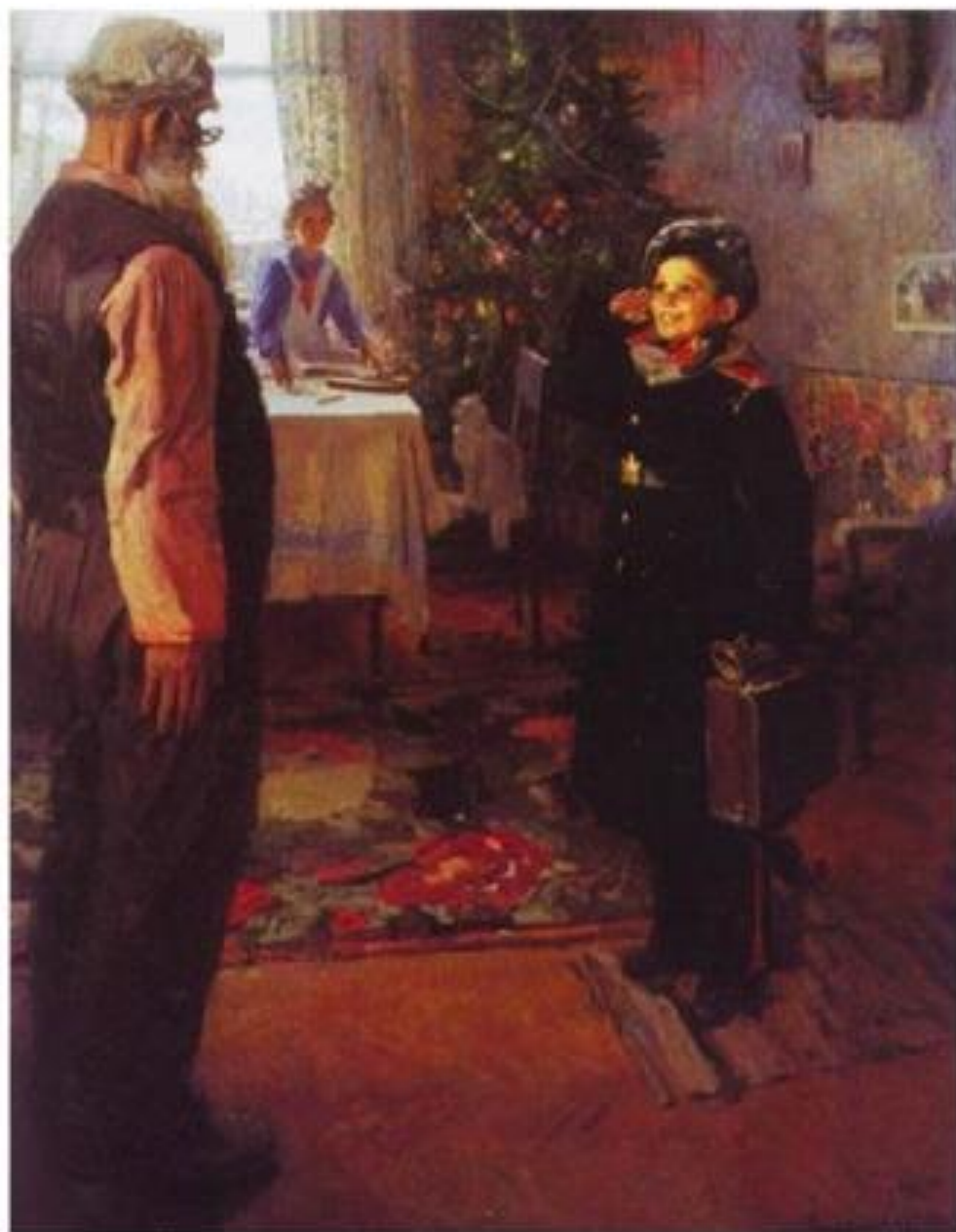
«Прибыл на каникулы» 1948 г.