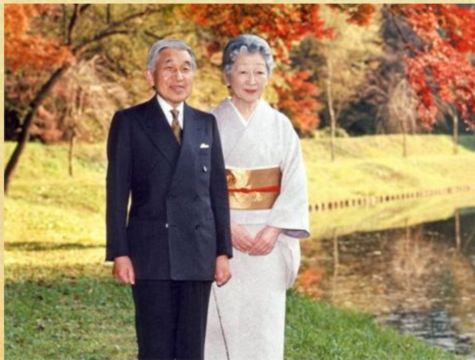
125-ый император Японии Акихито и его супруга Митико

Япония — это единственная в мире империя. С самого основания Японии, в 711 г до н.э., власть Императорской династии в этой стране не прерывалась.