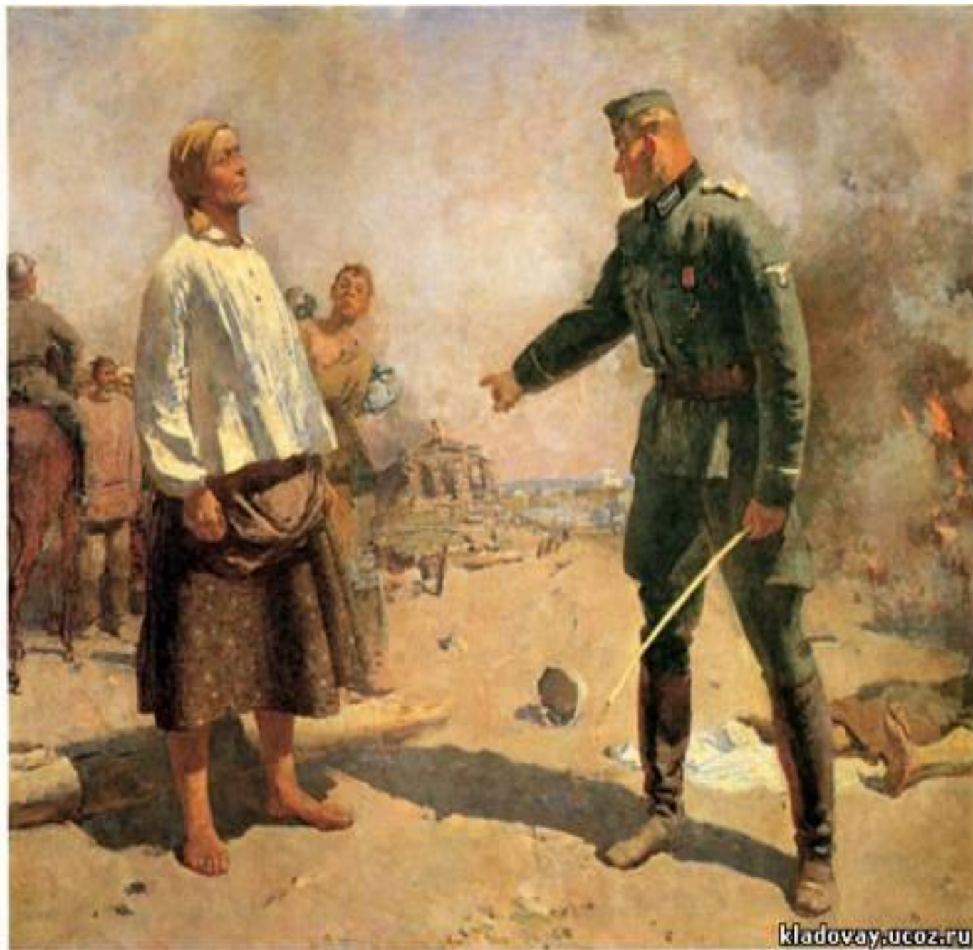
Сергей Герасимов «Мать партизана»