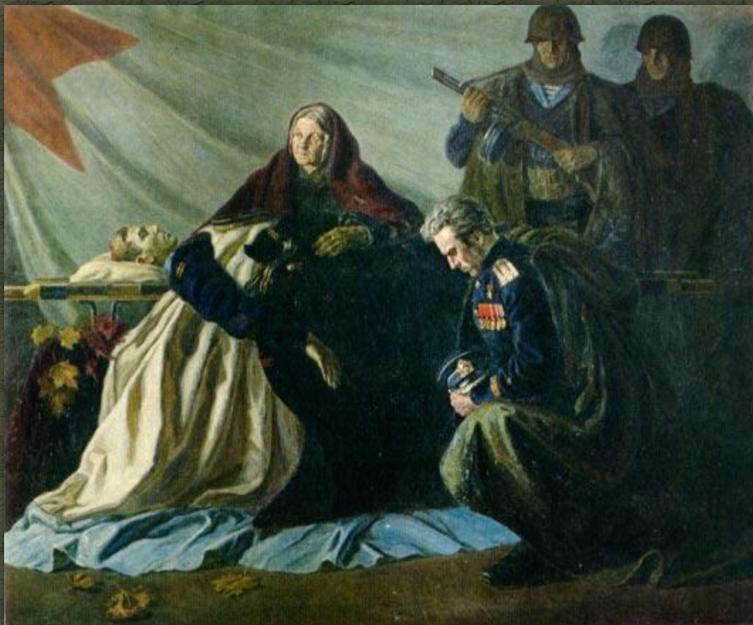
Федор Богородский «Слава павшим героям».