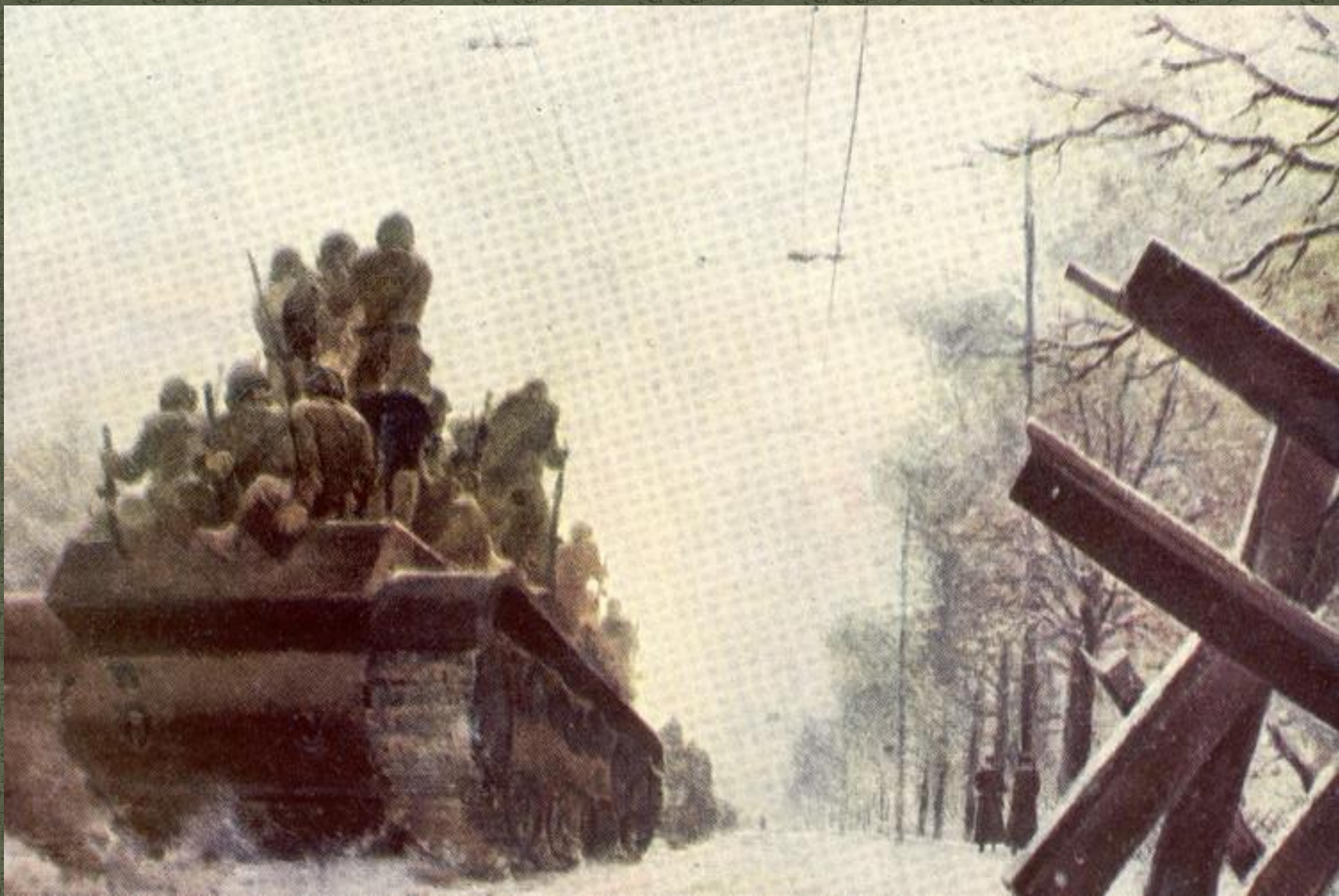
Г. Нисский «На защиту Москвы»