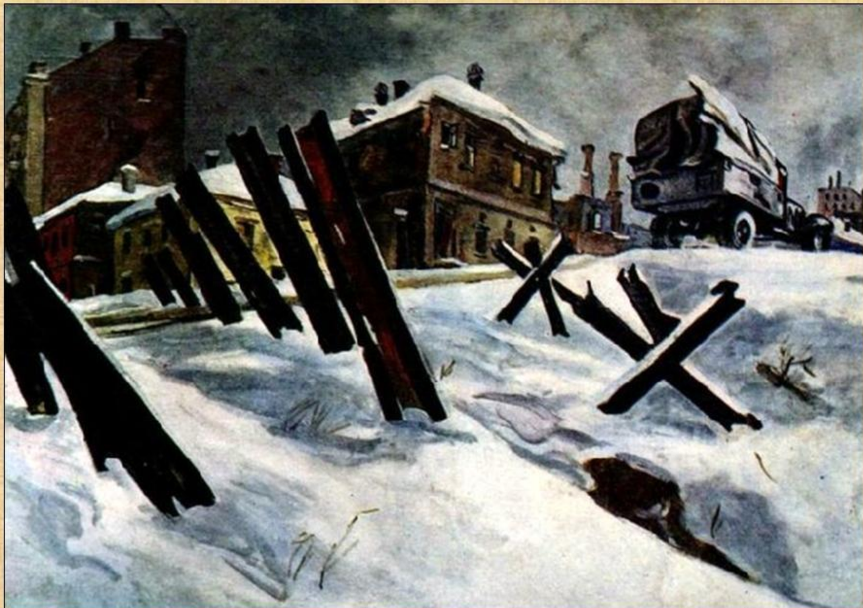
Дейнека А. Окраина Москвы