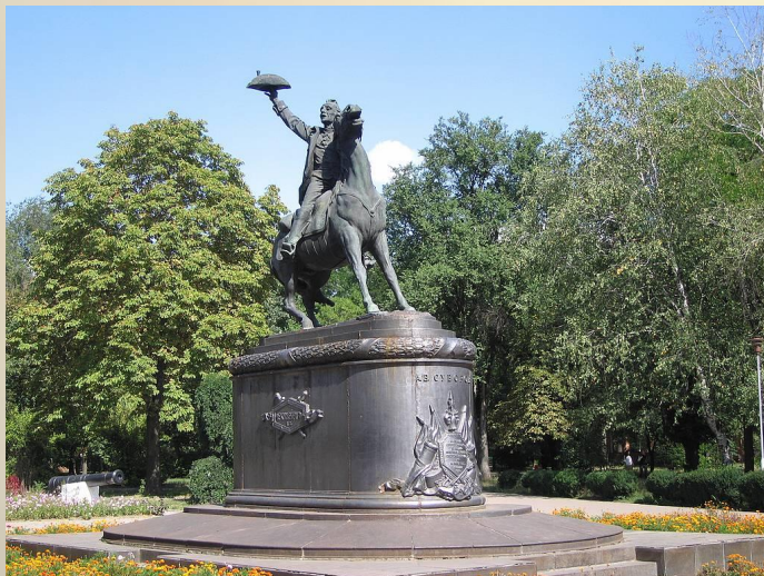
Памятник А. В. Суворову