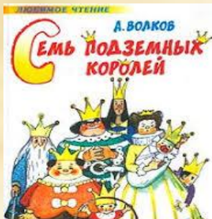
Семь подземных королей

Вопрос № 4 В какой сказке личность, во всех отношениях весьма серая, вынашивала преступный замысел покушения на жизнь несовершеннолетних?