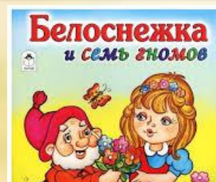
Белоснежка и семь гномов