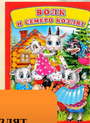
Волк и семеро козлят