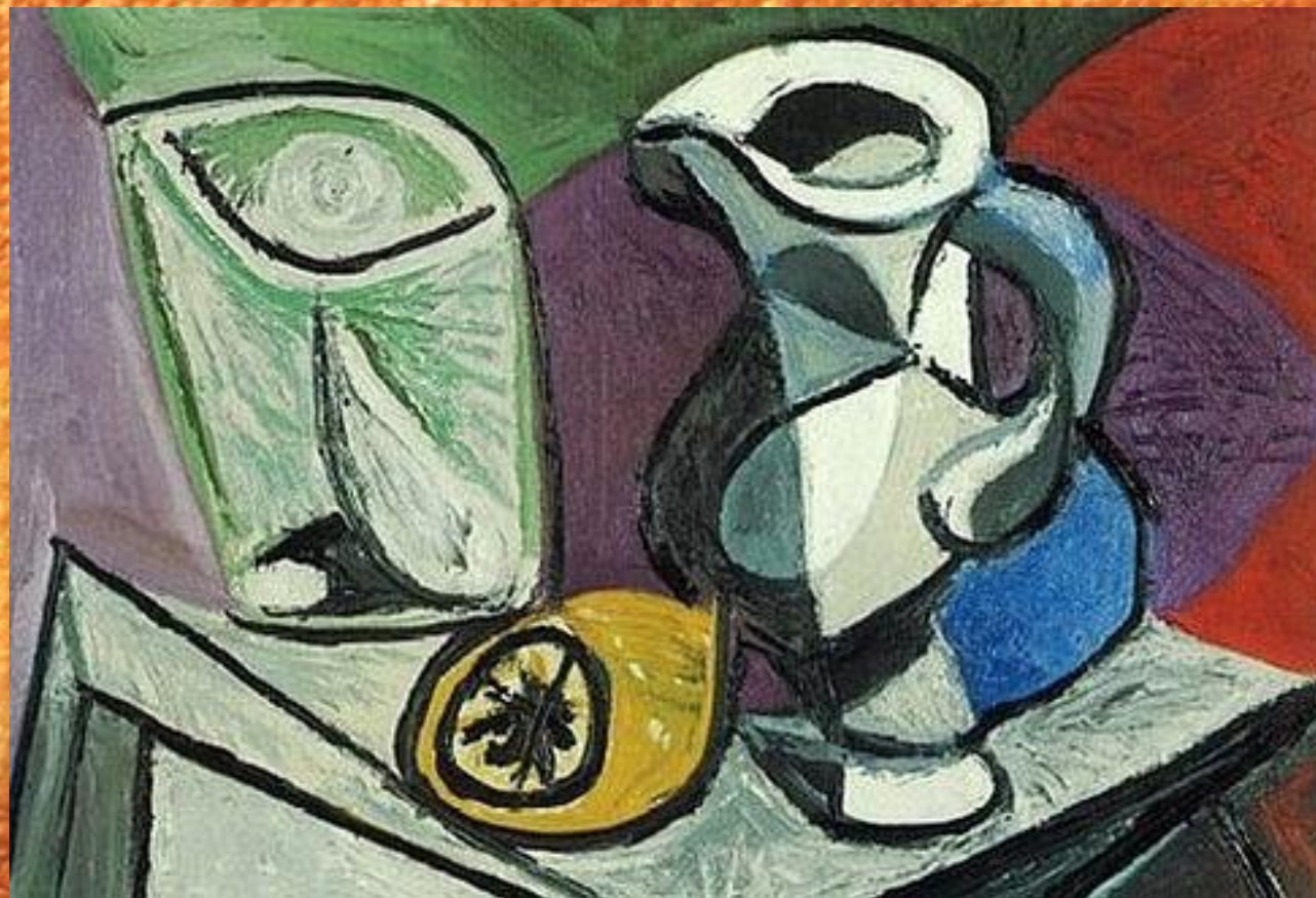
Натюрморт. Стакан и кувшин