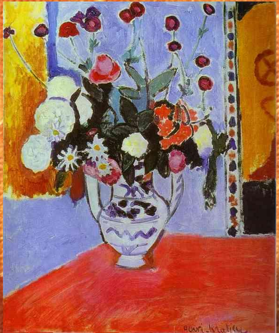
Натюрморт. Ваза с цветами.