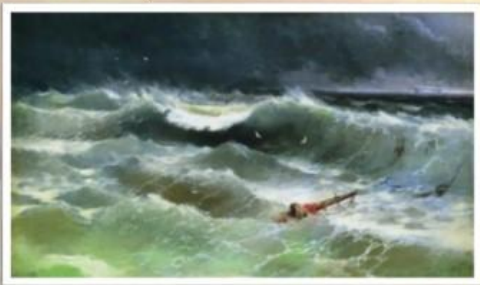
Буря на ледовитом И.К. Айвазовский

Тихое, спокойное и гладкое как стекло, бушующее, страшное. Очень трудно нарисовать такое изменчивое море. Но зато и очень интересно. Многие художники пытались передать в своих картинах красоту морской стихии, а лучше всего это удавалось именно Ивану Константиновичу Айвазовскому.