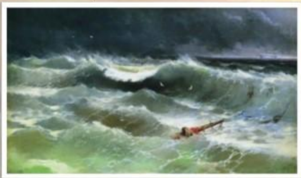
Буря на ледовитом И.К. Айвазовский

Тихое, спокойное и гладкое как стекло, бушующее, страшное. Очень трудно нарисовать такое изменчивое море. Но зато и очень интересно. Многие художники пытались передать в своих картинах красоту морской стихии, а лучше всего это удавалось именно Ивану Константиновичу Айвазовскому.