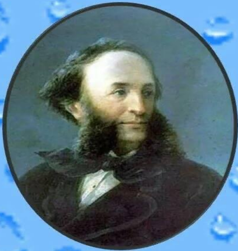
Иван Константинович Айвазовский