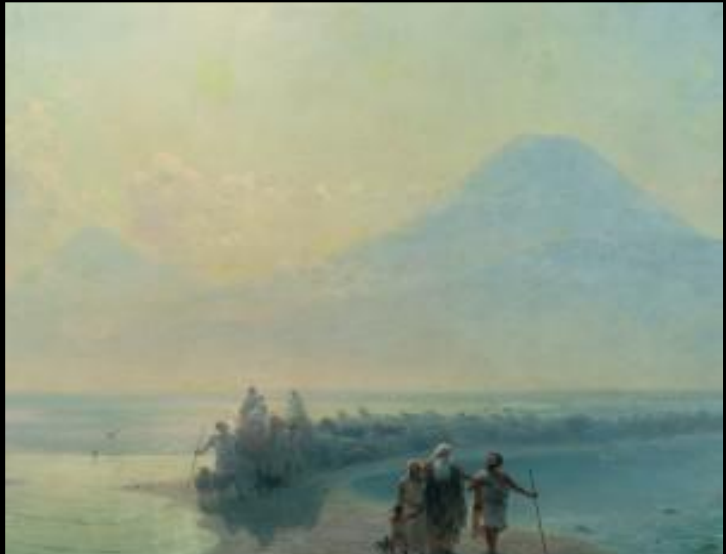
Сошествие Ноя с Арарата. и. Айвазовский. 1889 г. Ереван, Национальная галерея Армении

Шестьсот первого года [жизни Ноевой] к первому [дню] первого месяца иссякла вода на земле; и открыл Ной кровлю ковчега и посмотрел, и вот, обсохла поверхность земли. И во втором месяце, к двадцать седьмому дню месяца, земля высохла. И сказал [Господь] Бог Ною: выйди из ковчега ты и жена твоя, и сыновья твои, и жены сынов твоих с тобою; выведи с собою всех животных, которые с тобою, от всякой плоти, из птиц, и скотов, и всех гадов, пресмыкающихся по земле: пусть разойдутся они по земле, и пусть плодятся и размножаются на земле. И вышел Ной и сыновья его, и жена его, и жены сынов его с ним; все звери, и [весь скот, и] все гады, и все птицы, все движущееся по земле, по родам своим, вышли из ковчега.