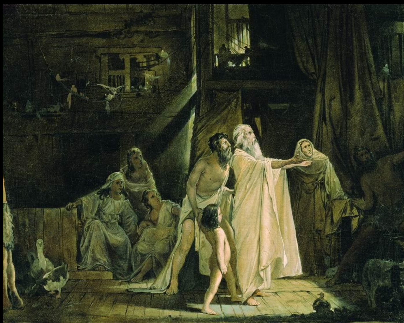
Ноев ковчег. А. Рябушкин. 1882 г. Государственный Русский музей, СПб

И сделал Ной всё: как повелел ему [Господь] Бог, так он и сделал. И сказал Господь [Бог] Ною: войди ты и все семейство твое в ковчег, ибо тебя увидел Я праведным предо Мною в роде сем; и всякого скота чистого возьми по семи, мужского пола и женского, а из скота нечистого по два, мужского пола и женского; также и из птиц небесных [чистых] по семи, мужского пола и женского, [и из всех птиц нечистых по две, мужского пола и женского,] чтобы сохранить племя для всей земли, ибо чрез семь дней Я буду изливать дождь на землю сорок дней и сорок ночей; и истреблю все существующее, что Я создал, с лица земли. Ной сделал все, что Господь [Бог] повелел ему.