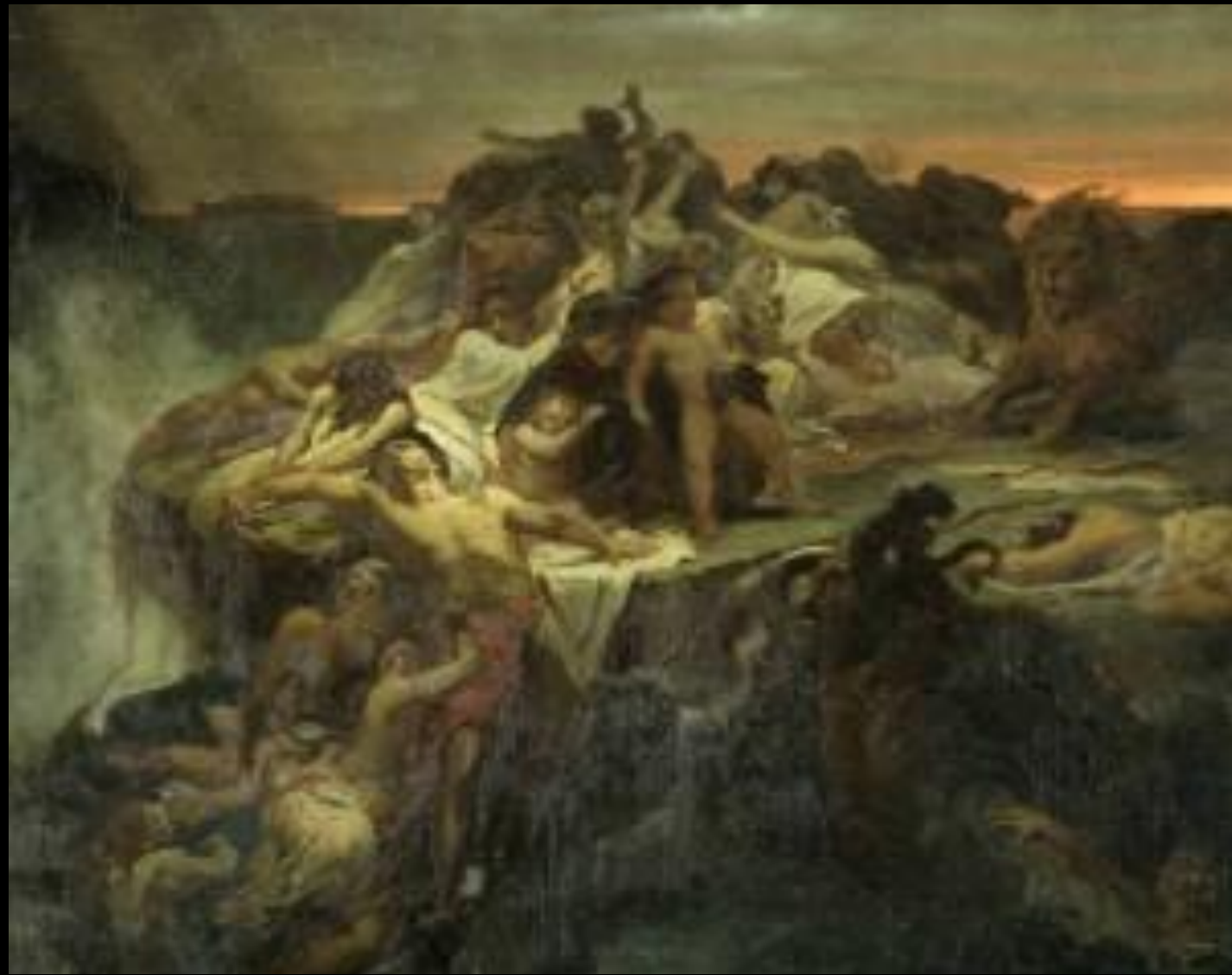
Всемирный потоп. Эскиз. В. П. Верещагин. 1869 г. Государственный Русский музей, СПб

И сказал [Господь] Бог Ною: конец всякой плоти пришел пред лице Мое, ибо земля наполнилась от них злодеяниями; и вот, Я истреблю их с земли. Сделай себе ковчег из дерева гофер; отделения сделай в ковчеге и осмоли его смолою внутри и снаружи. И сделай его так: длина ковчега триста локтей; ширина его пятьдесят локтей, а высота его тридцать локтей.