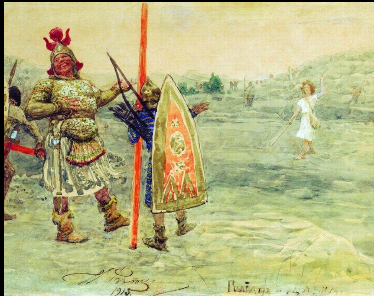
Давид и Голиаф. И. Репин. 1915 г. Тверская областная картинная галерея

С этими словами Давид вытащил из сумки гладкий круглый камень, положил его в пращу, отвел назад руку и выпустил камень. Камень поразил Голиафа в лоб, и гигант с ужасным грохотом упал навзничь. Давид быстро подбежал к поверженному врагу, выхватил меч и отрубил ему голову.