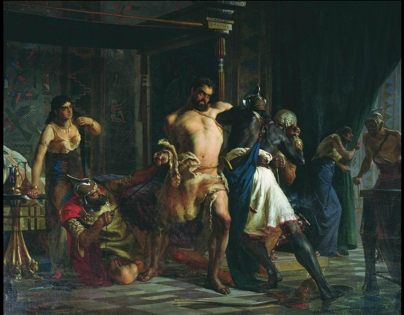
Самсон и Далила. А. Кившенко. 1876 г. Чувашский государственный художественный музей

Самсон, герой ветхозаветных преданий, наделённый невиданной физической силой. Виновницей гибели Самсона становится его возлюбленная - филистимлянка Далила из долины Сорек. Подкупленная «властителями филистимскими», она трижды пытается выведать у Самсона источник его чудесной силы, но Самсон трижды обманывает её, говоря, что он станет бессильным, если его свяжут семью сырыми тетивами, или опутают новыми верёвками, или воткнут его волосы в ткань. По ночам Далила осуществляет всё это, но Самсон, просыпаясь, с лёгкостью разрывает любые путы. Наконец, устав от упрёков Далилы в нелюбви и недоверии к ней, Самсон «открыл ей всё сердце своё»: он назорей божий от чрева матери, и, если остричь ему волосы, обет нарушится, сила покинет его и он станет, «как прочие люди».