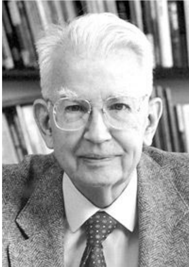
Рональд Коуз (1910-2013)