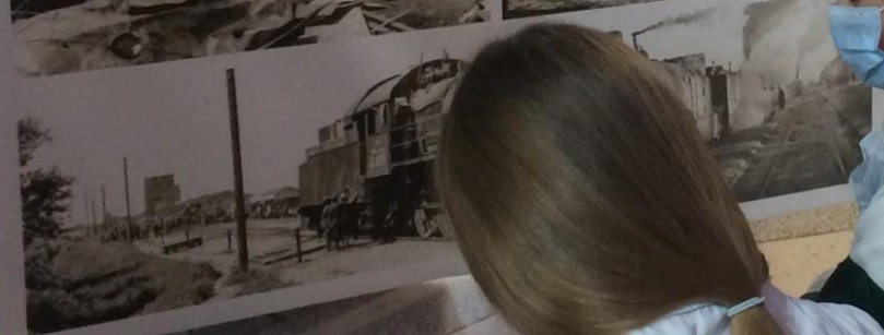
Тащинский район. Станция Тащинская оккупирована 16 июля 1942 года. Освобождена 15 января 1943 года.