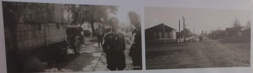
Железнодорожная станция Морозовская. Город Морозовск оккупирован 15 июля 1942 года, освобождён 5 января 1943 года.