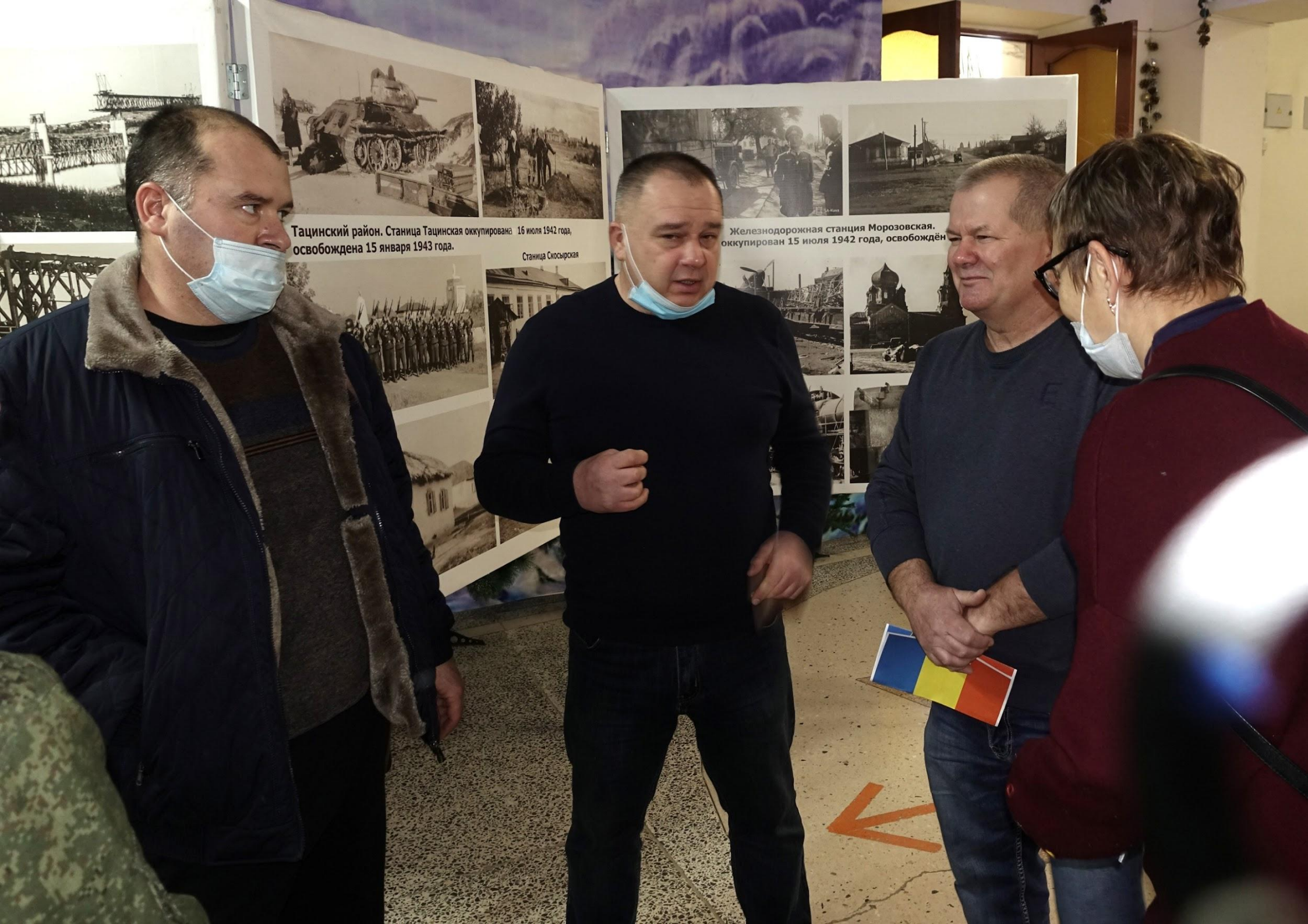
Тацинский район. Станица Тацинская оккупирована 16 июля 1942 года, освобождена 15 января 1943 года.