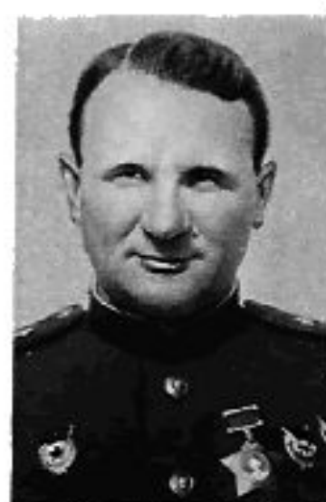
И. М. Чистяков

Кавалеры ордена Суворова - В. М. Баданов, П. И. Батов, В.Т. Вольский, Р.Я. Малиновский, К.С. Москаленко, С.И. Руденко, Ф.Я. Фалалеев, И.М. Чистяков