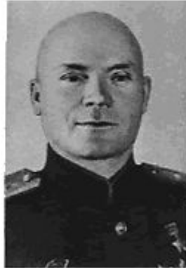
Д. Д. Лелюшенко