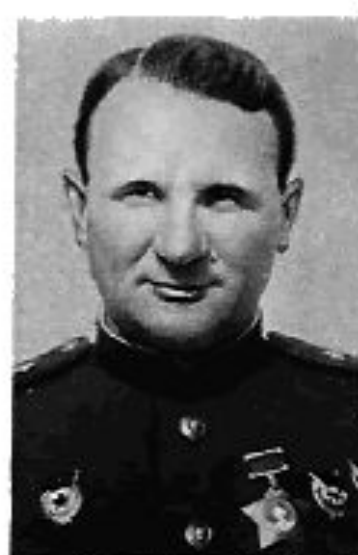
И. М. Чистяков

Кавалеры ордена Суворова - В. М. Баданов, П. И. Батов, В.Т. Вольский, Р.Я. Малиновский, К.С. Москаленко, С.И. Руденко, Ф.Я. Фалалеев, И.М. Чистяков