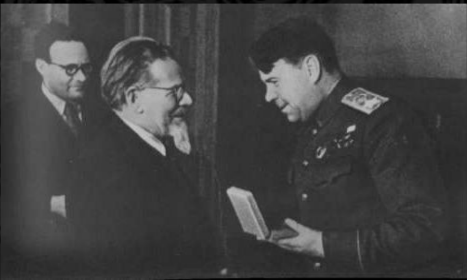
Председатель Президиума Верховного Совета СССР М. И. Калинин вручает орден Суворова I степени Маршалу Советского Союза А. М. Василевскому. Москва, Кремль, 19 февраля 1943 г.