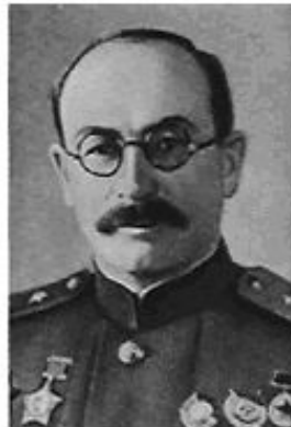
П. А. Ротмистров