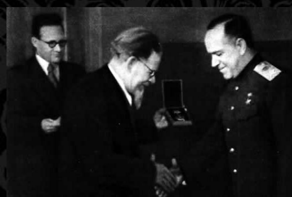
Председатель Президиума Верховного Совета СССР М. И. Калинин вручает орден Суворова I степени № 1 Маршалу Советского Союза Г. К. Жукову. Москва, Кремль, 4 февраля 1943 г.