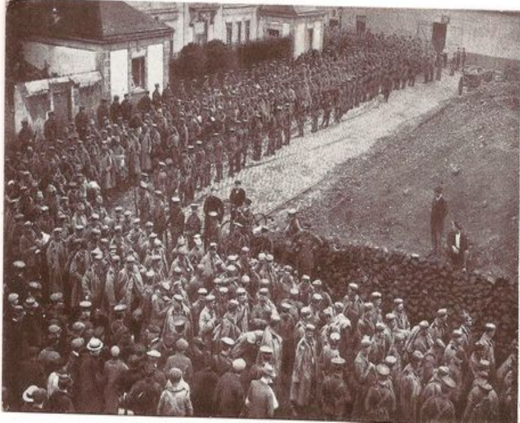
Prisonniers Allemands capturés par les Anglais. German prisoners captured by the English.