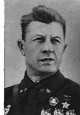
А. И. Родимцев