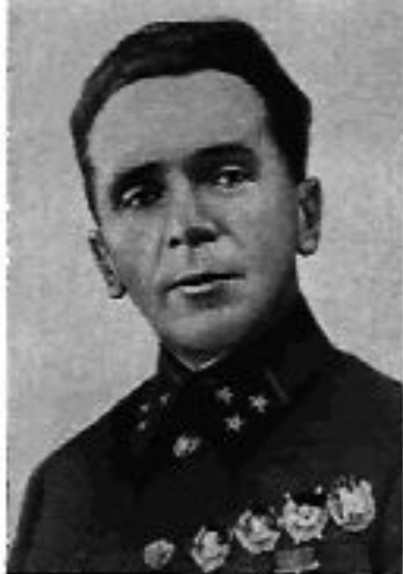
П. И. Батов