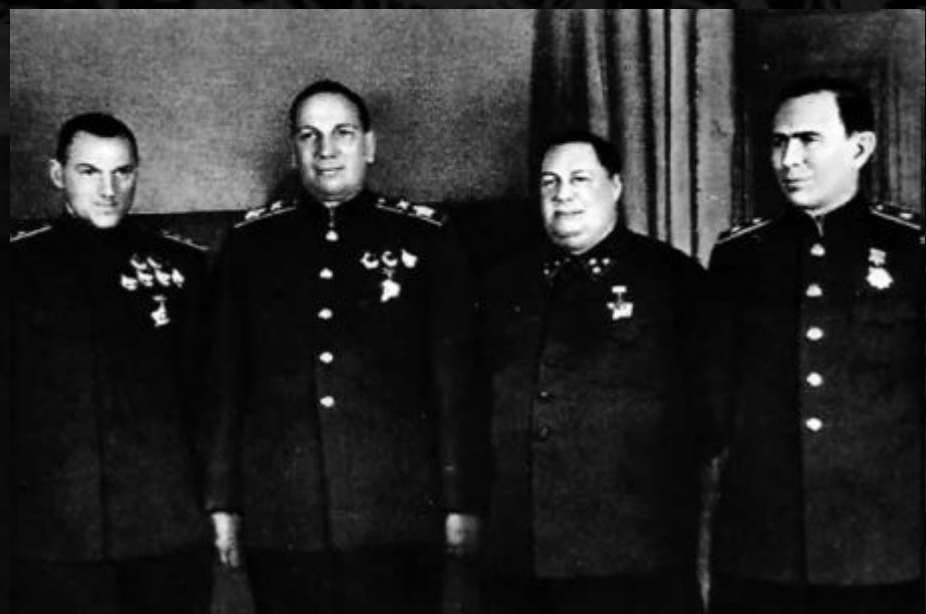
Генерал-полковник К.К.Рокоссовский, маршал артиллерии Н.Н.Воронов, генерал-лейтенант Ф.И.Толбухин и генерал-лейтенант М.С.Громадин после вручения им орденов. Москва, Кремль, 5 февраля 1943г.