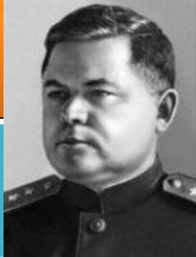
Ватутин Николай Федорович

21-я, 5-я танковая, 1-я гвардейская, 17-я и 2-я воздушные армии