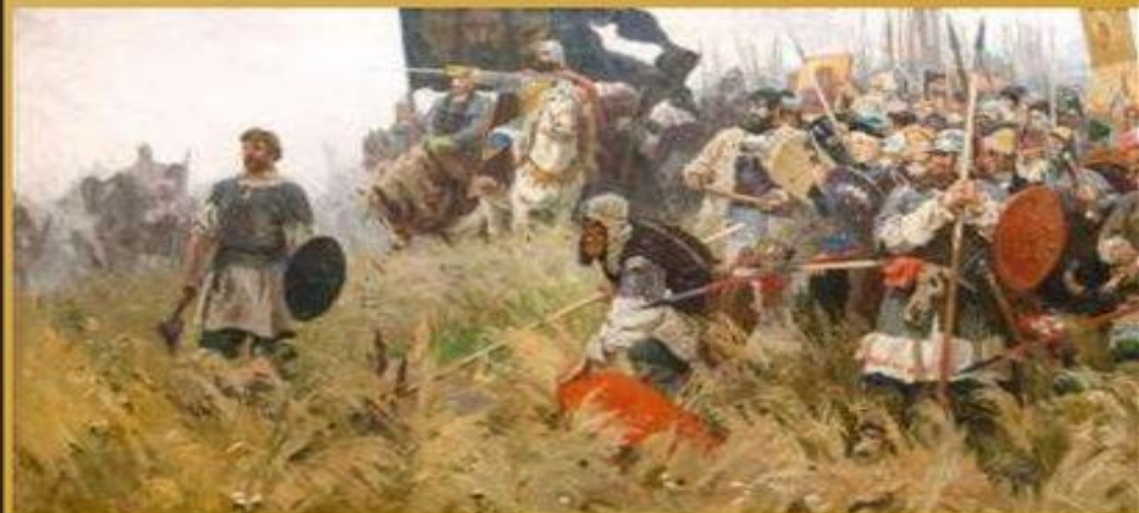
А. Бубнов Утро на Куликовом поле

Сражение между русским войском во главе с московским князем Дмитрием Донским и армией темника Золотой Орды Мамая . Разгром основных сил Орды.