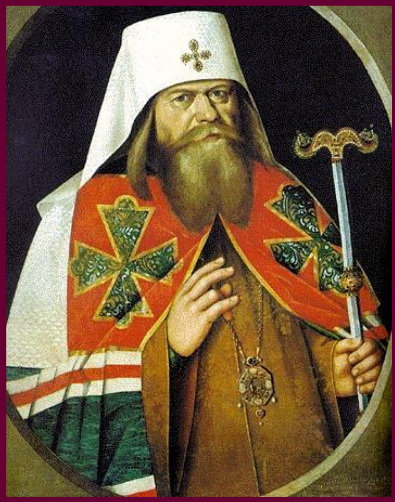
Патриарх Андриан. Копия с парсуны 1696 г.

Церковь еще в 90-е г. 17 в. враждебно отнеслась к деятельности Петра.