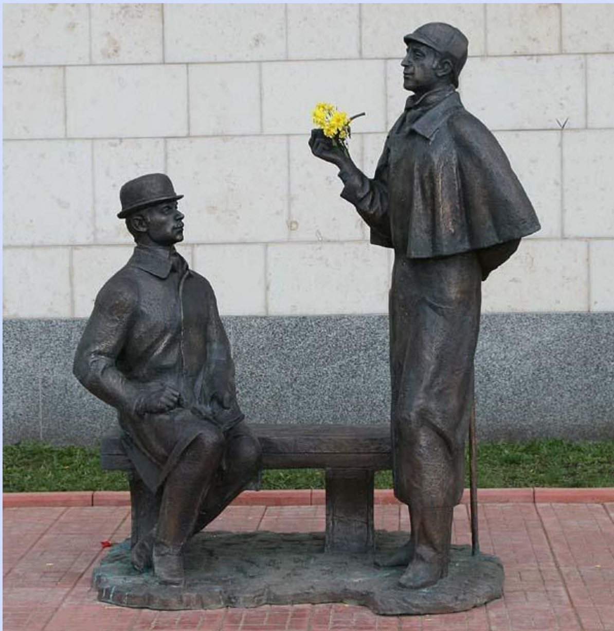
Россия, г. Москва