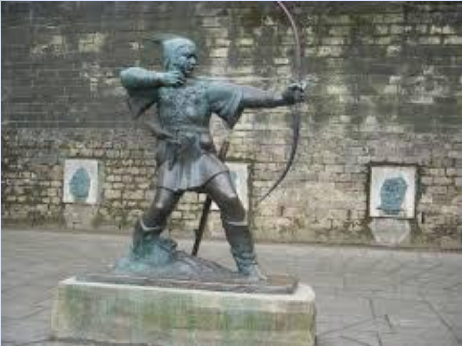
Великобритания, г. Ноттингем