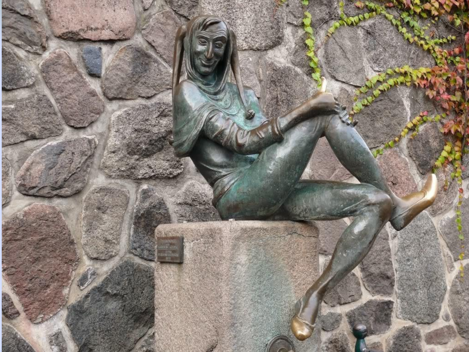
Германия, г. Мёльн