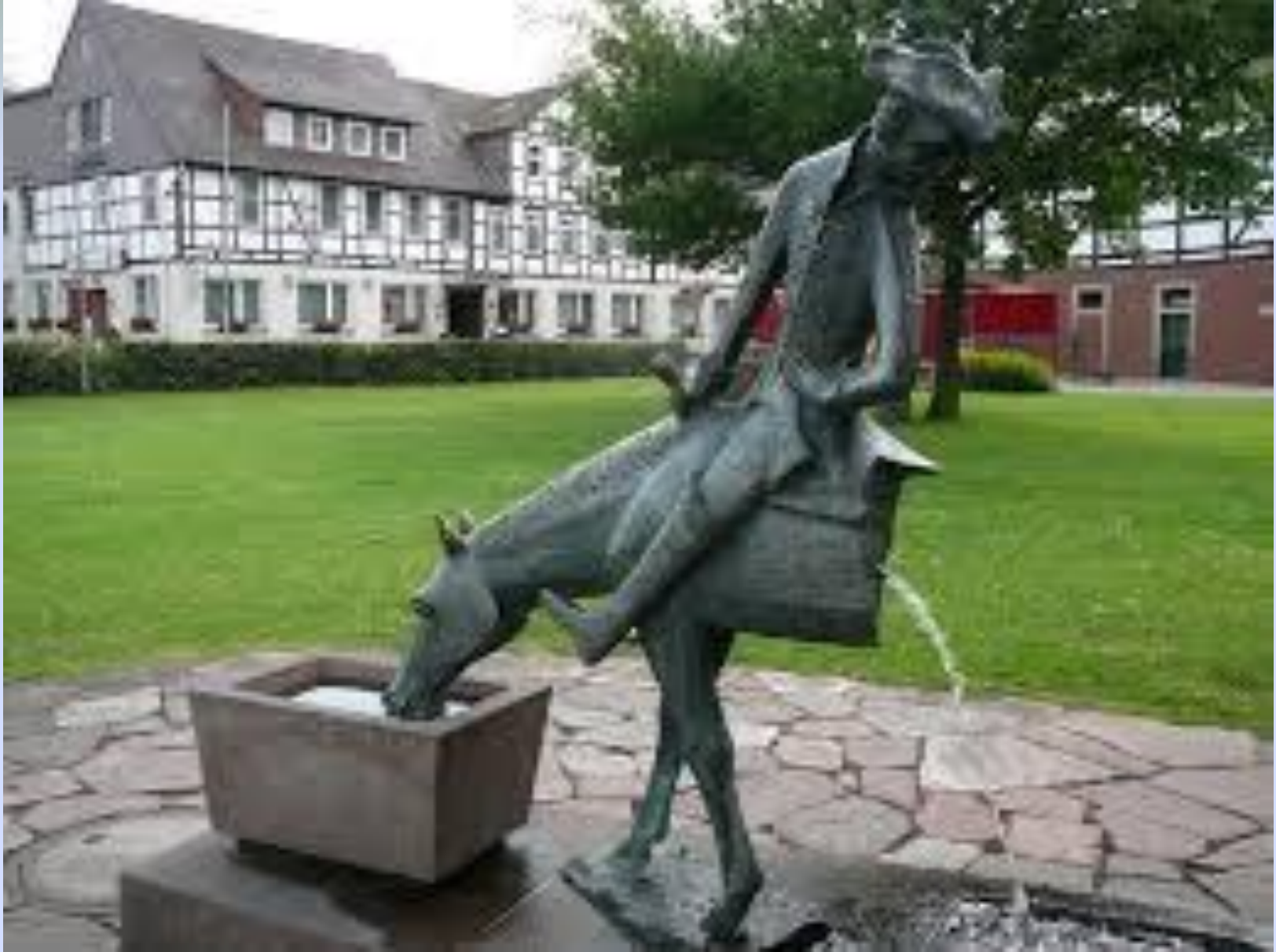
Германия, г. Боденвердер