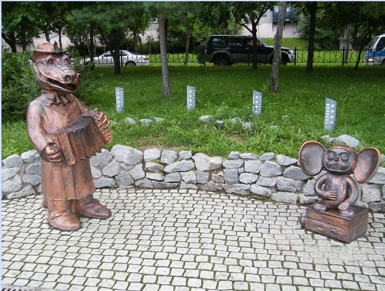
Россия, г. Хабаровск