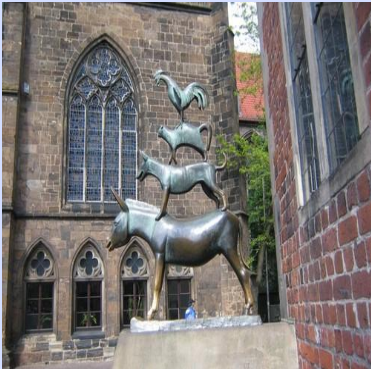
Германия, г. Бремен