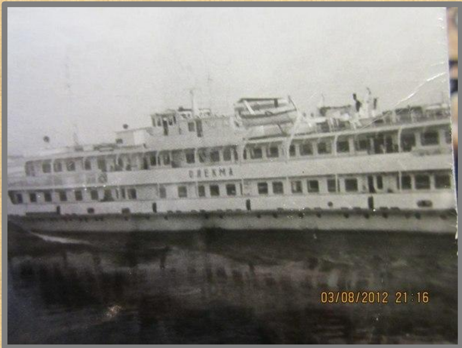
«Олекма», «Пинега», «Неман», «Индигирка»