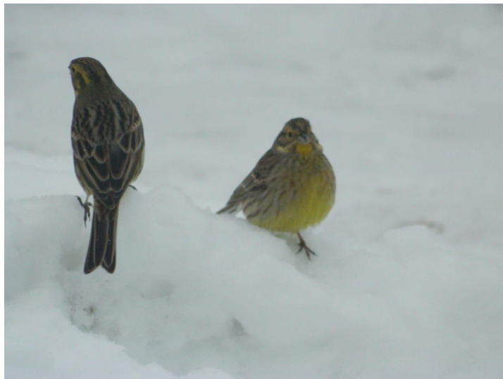
В ожидании обеда Декабрь 2020 г.

Прибрежная зона реки Овчинной является обыкновенной местом зимовки зеленушки обыкновенной.