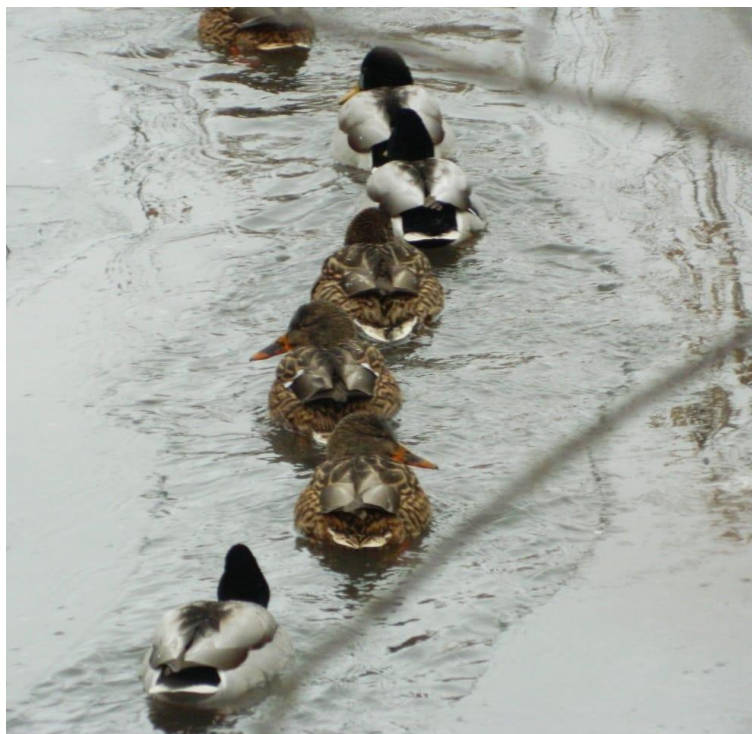
Утиная семейка. Декабрь 2020 г.