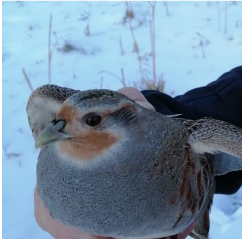
Серая куропатка. Декабрь 2020 г.

На лугу, расположенном в пойме реки Овчинная, в камышовых зарослях круглый год живут серые куропатки.