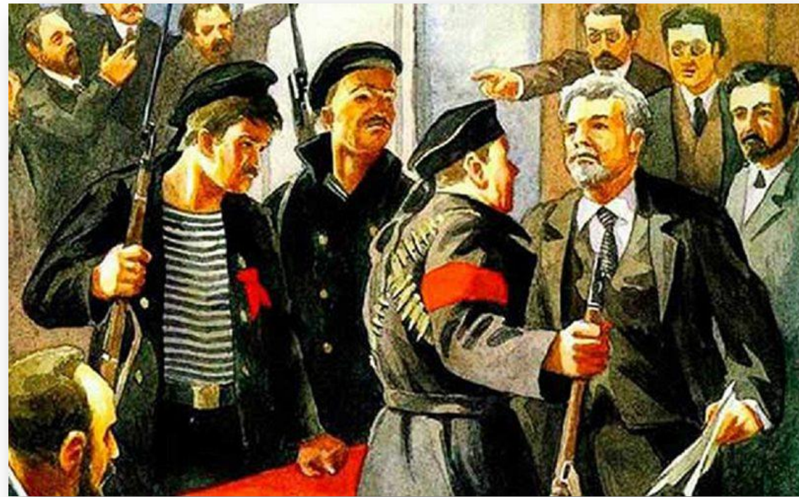
Разгон Учредительного собрания

После этого большевики объявили все другие партии контрреволюционными. Эти действия оттолкнули от большевиков интеллигенцию, буржуазию и часть крестьянства, которая симпатизировал. Один из главных лозунгов большевиков — « мир без аннексий и контрибуций » — был очень популярен в народе, но он не нашел отклика ни у одной из воюющих сторон. Поэтому, не имея сил для сдерживания наступления немцев и стремясь во что бы то ни стало удержать власть, 3 марта 1918 года большевики подписали сепаратный Брестский мирный договор с Германией. Условия договора были унижительными: Россия признавала независимость Украины, Беларуси, Финляндии и Прибалтики, выплачивала огромную контрибуцию в размере 6 млрд марок, должна была демобилизовать армию и флот