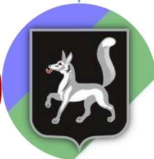
Пресс-служба Администрации МР «Удорский»