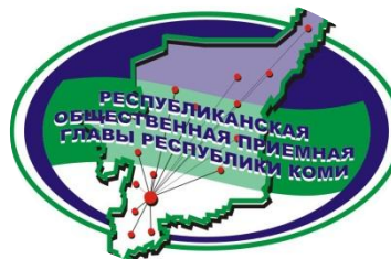
Удорский филиал Общественной приемной Главы РК