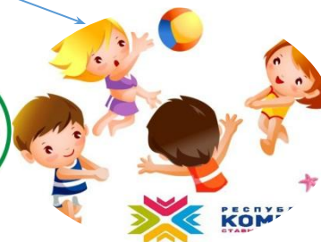
МУДО «Удорская ДЮСШ»