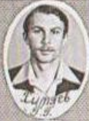
Лундзев 3 3