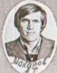
Шакиров 3 3