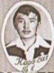
Коро-сал 3 3