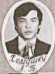
Толушки 1 3