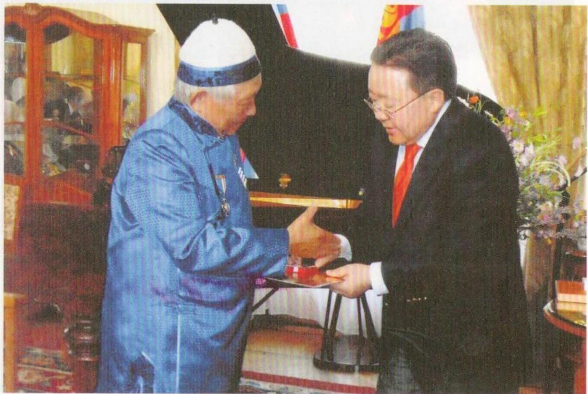
Президент Монголии Ц. Элбэгдорж вручает награду Ч-Д. Ондару в честь 70-ия окончания Великой Отечественной Войны.