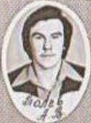
Залев 3 3