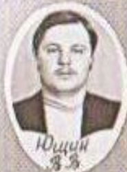
Юшин 3 3