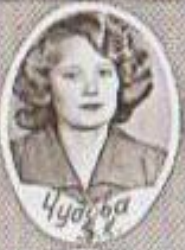
Чуаева 3 3