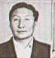
Сат С С декан