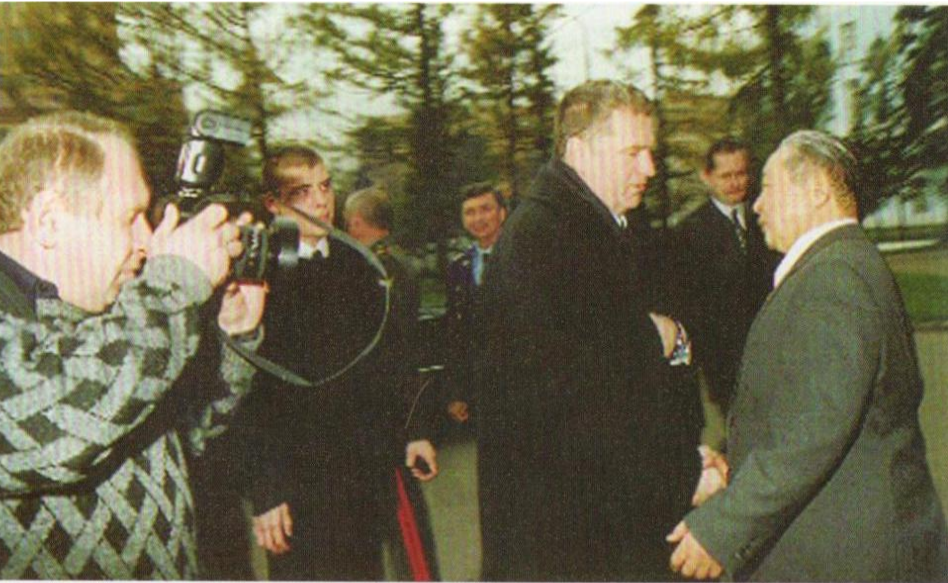
Встреча с В. Жириновским перед съездом Ассамблеи народов России.