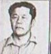
Базур-оол 3 3 директор