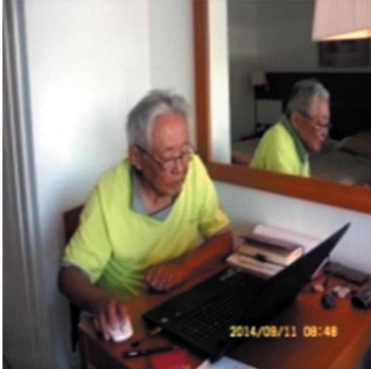
Ондал за компьютером. Штат Флорида, США, 2011 год