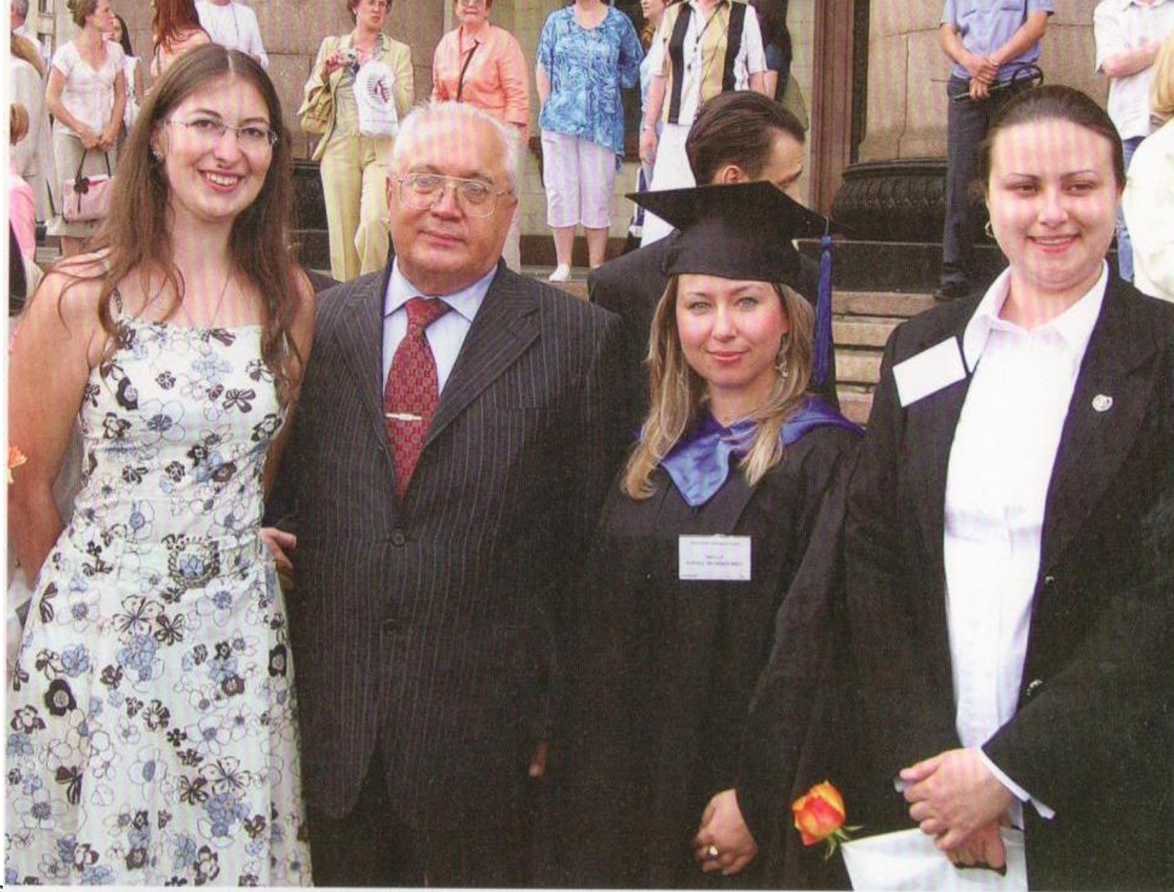
Внучка Лена среди выпускников с золотыми медалями и академиком В. Садовничим - ректором МГУ.