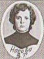
Ногоба 3 3