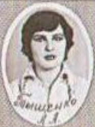
Свищенко 3 3