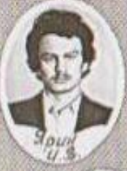
Ярим У 3