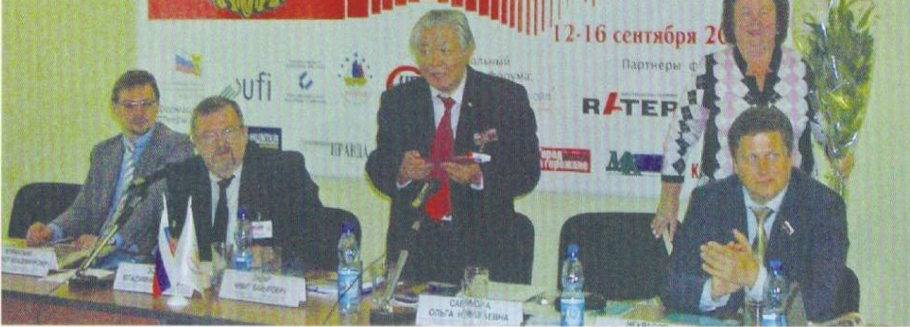
Общероссийский форум Ассамблеи народов России "Россия Единая". Нижний Новгород.