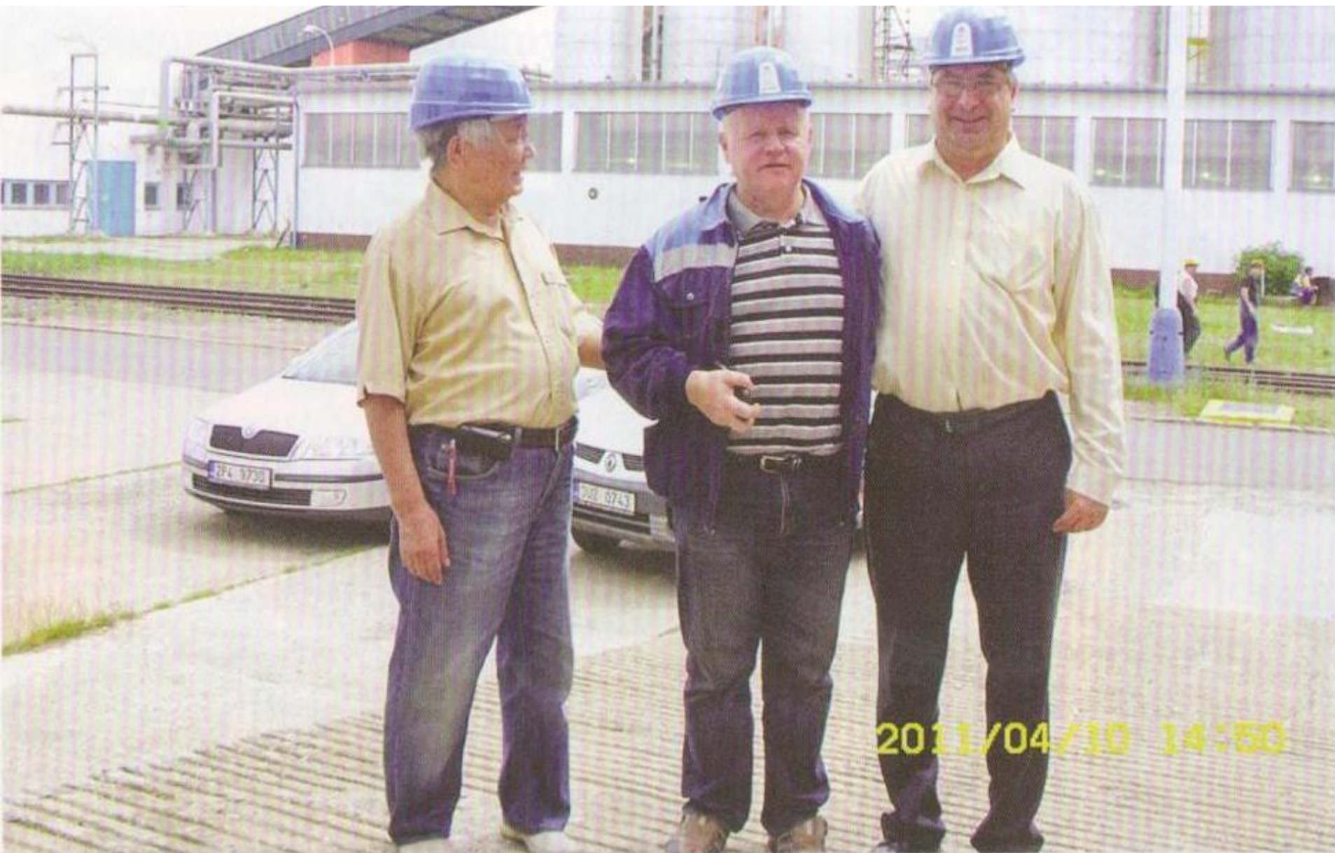
Чехия. г. Прага. Диалог предпринимателей о возведении строительства ТЭС-2.