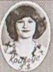
Кайбуца 3 3