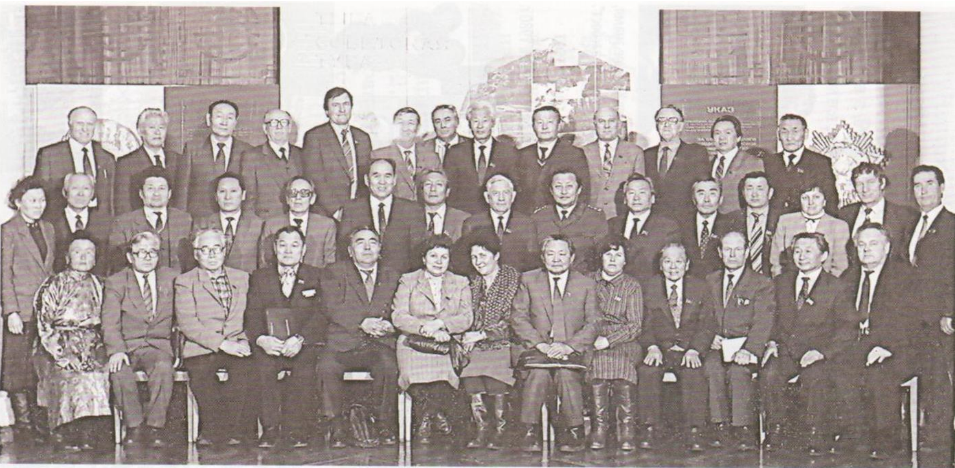
Президиум Верховного Совета собрал активистов с целью; "как поднять роль советских органов власти". 1985 год.