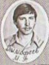
Шимдерев У 3