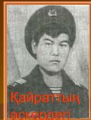
Қайраттың әскердегі кезі

Қ.Рысқұлбеков 1966жылы Жамбыл облысы Мойынқұм ауданы Көктерек ауылында дүниеге келген.