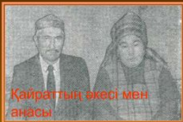
Қайраттың әкесі мен анасы