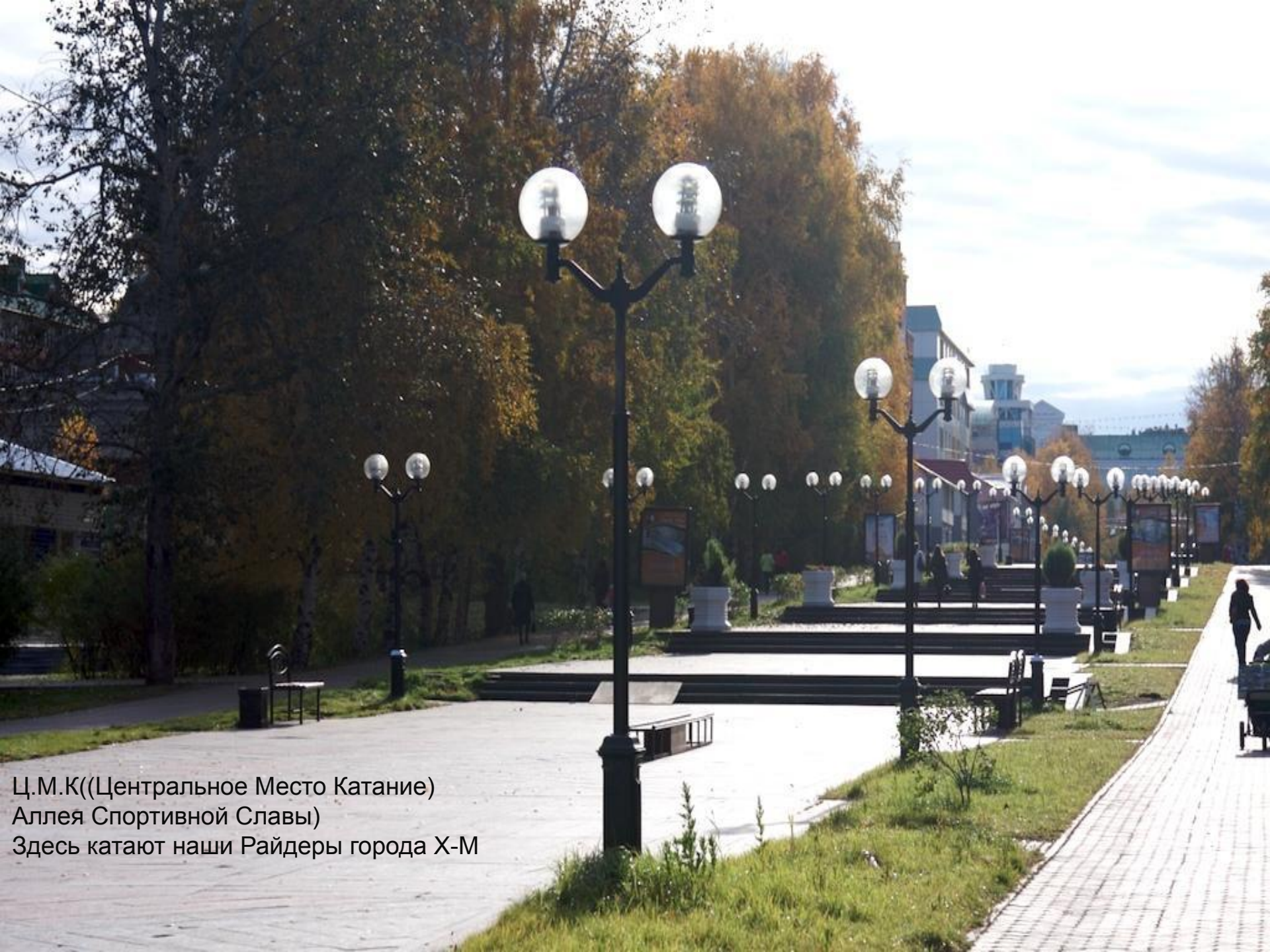
Ц.М.К((Центральное Место Катание) Аллея Спортивной Славы) Здесь катают наши Райдеры города Х-М