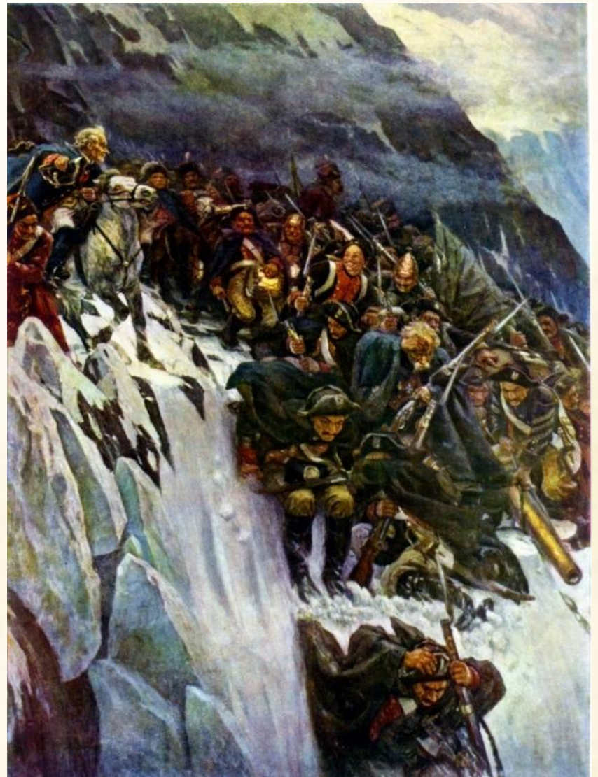
В. И. Суриков «Переход Суворова через Альпы»