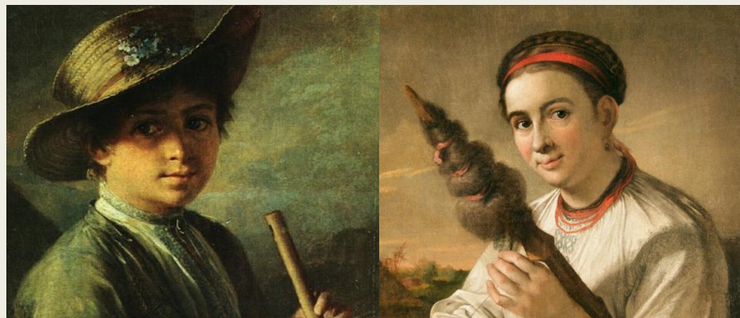
«Хлопчик зі жалею»