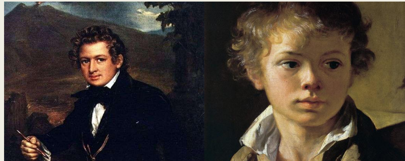
"Портрет К. П. Брюллова"