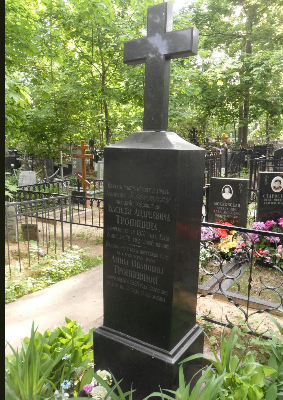
Могила В.А. Тропініна на Ваганьківському цвинтарі.