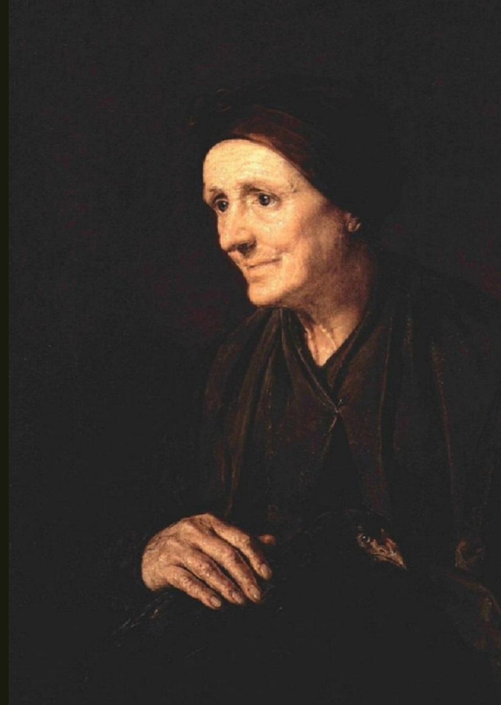
«Стара з куркою»