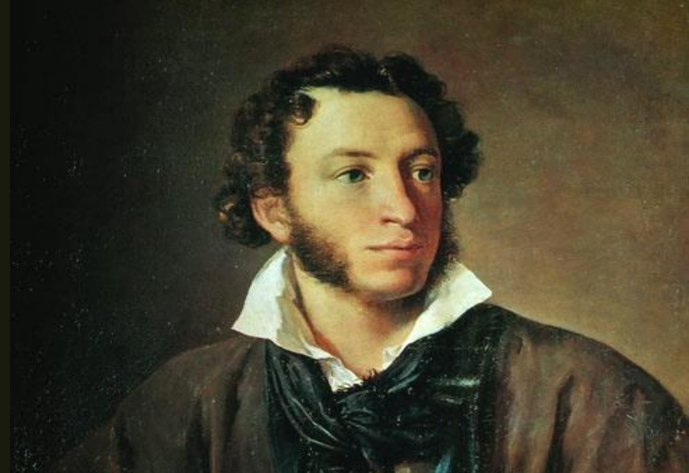
"Портрет О. С. Пушкіна"

За словами сучасників, портрет має вражаючу подібність із геніальним поетом, але вражає він ще й одухотвореністю, глибоким проникненням у внутрішній світ героя.