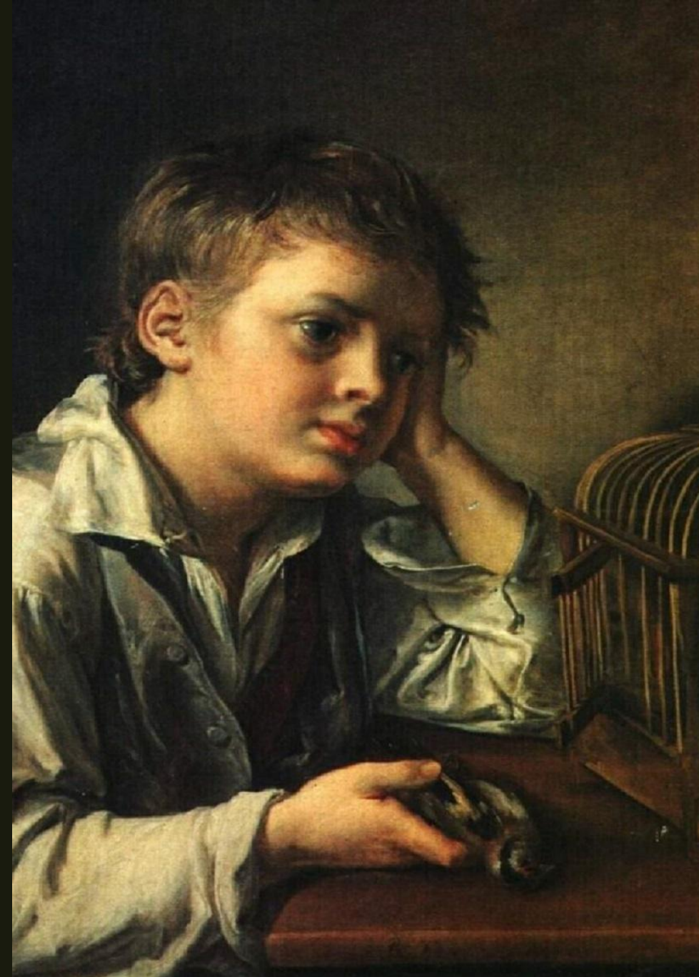
«Хлопчик, що сумує за своєю пташкою, що померла»