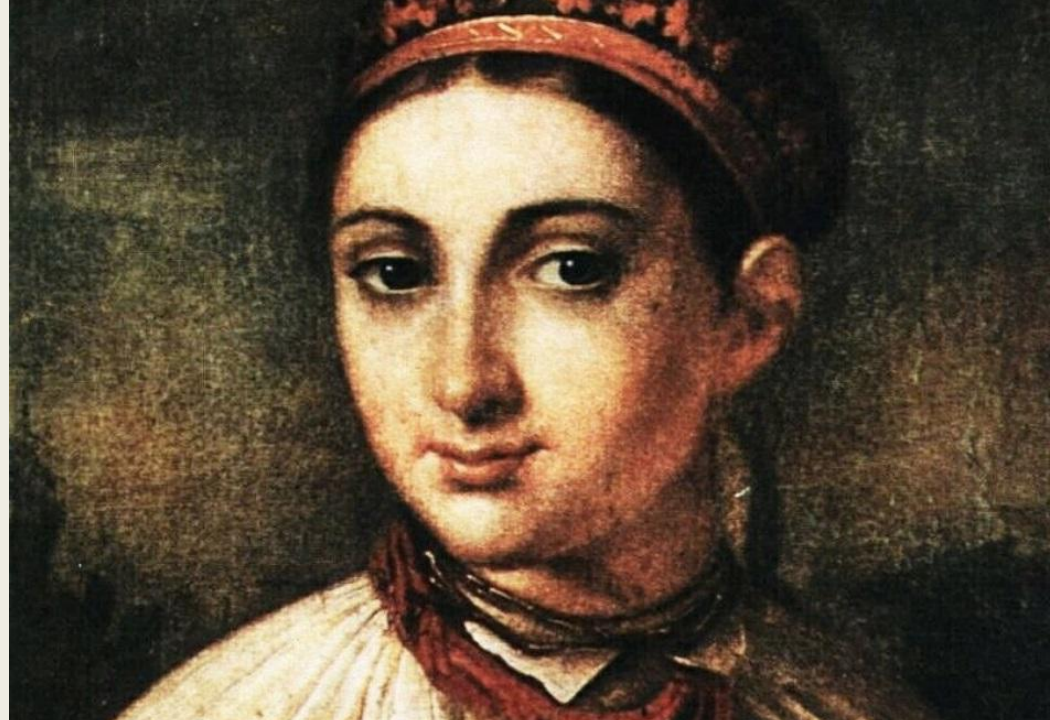
«Українська дівчина з Поділля»,