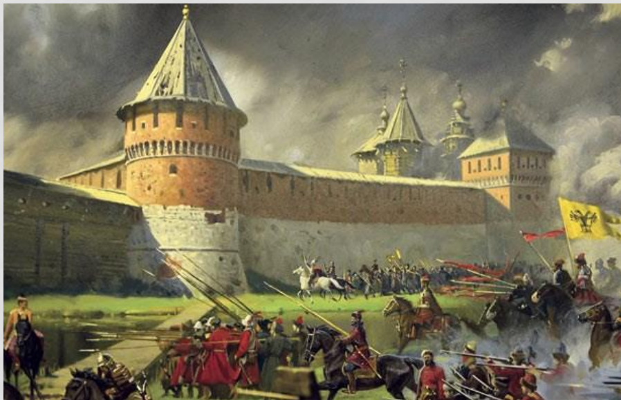
Осада Тульского кремля войском Девлет-Гирея. Фрагмент диорамы.