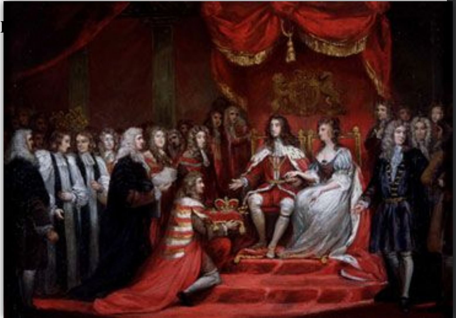
Вильгельм III и Мария II

Полное название документа – «Акт, декларирующий права и свободы подданного и устанавливающий наследование Короны»