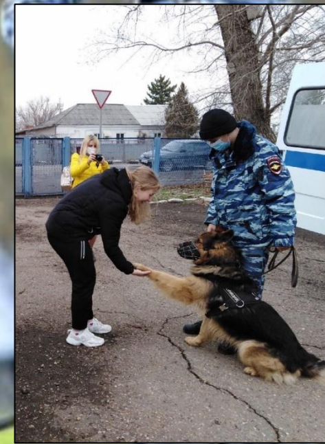
Дрессировка команды «рядом»