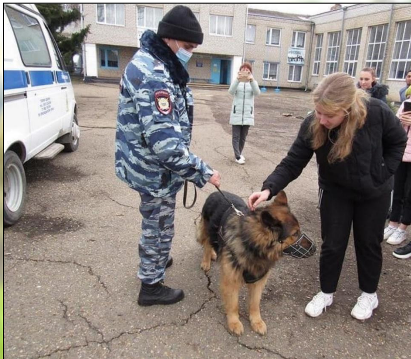
Команда «дай лапу»