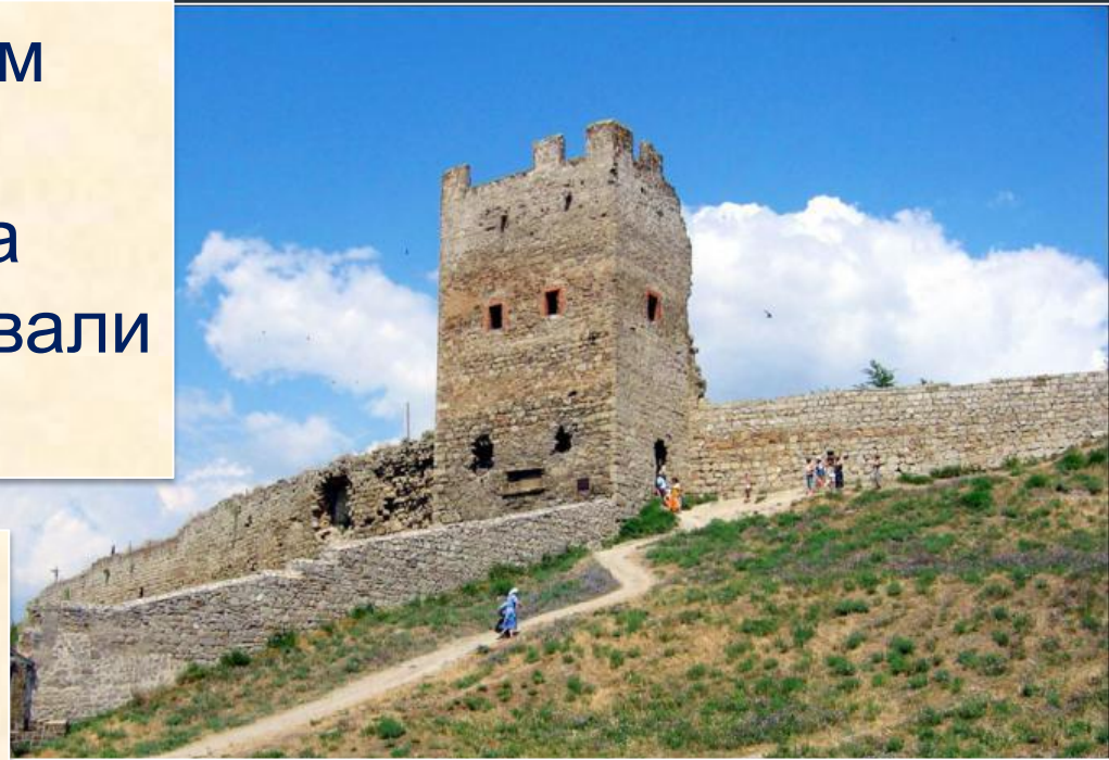
Генуэзская крепость г. Феодосия, Крым

Затем генуэзцы приобрели Балаклаву, Судак