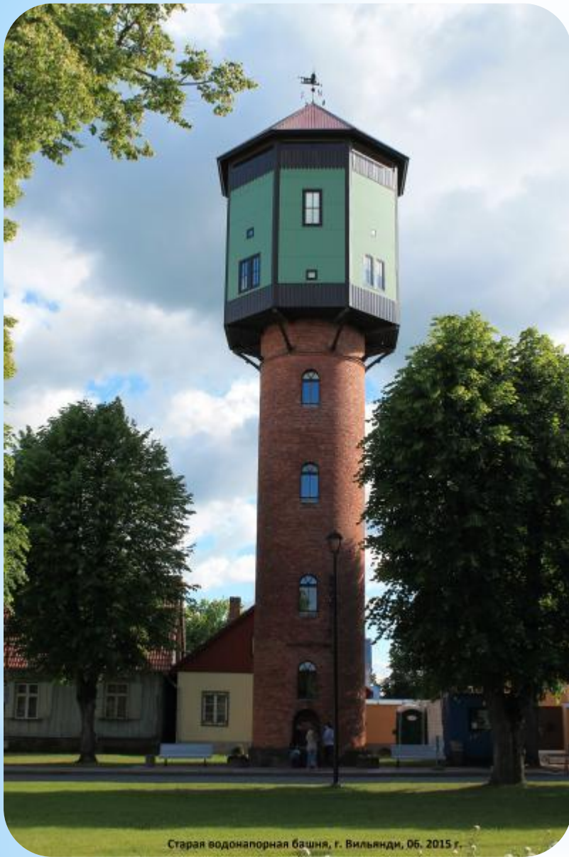
Старая водонапорная башня, г. Вильянди, 06. 2015 г.