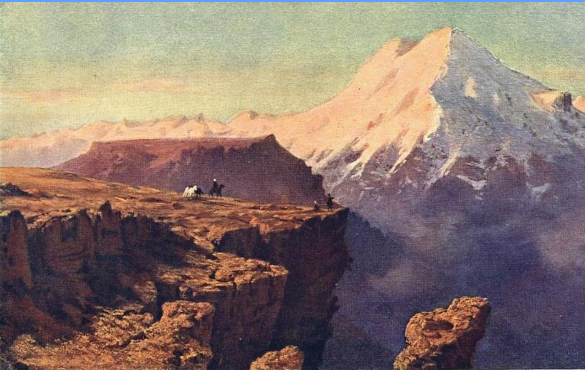
Кавказский вид с Эльбрусом. Масло. 1837