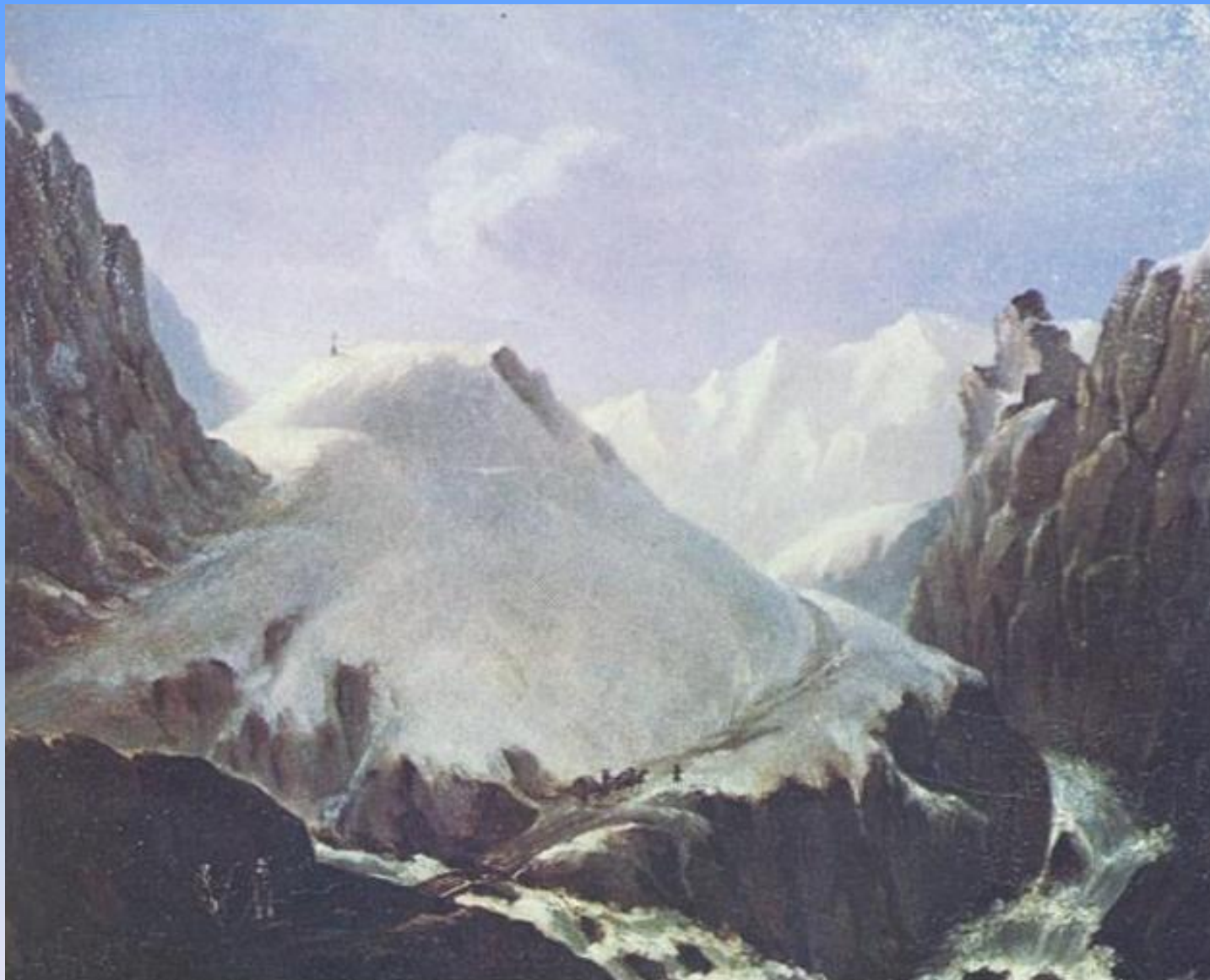
Крестовый перевал. Масло. 1837-1838