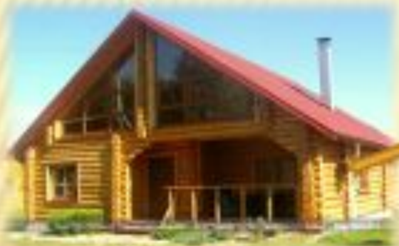
бани и дома