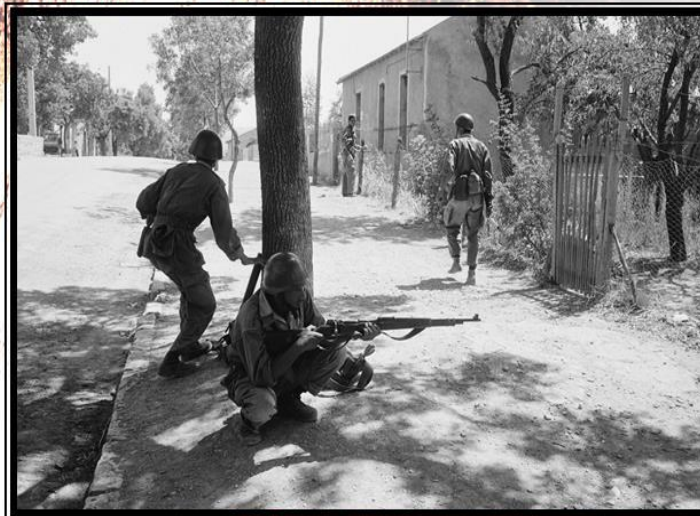
Бойцы Фронта национального освобождения Алжира во время войны за независимость, сентябрь 1962 год

Также советские военнослужащие участвовали в разминировании территорий Алжира в 1962–1964 годах. До этого освободительная война против французских колонизаторов, длившаяся 8 лет, закончилась провозглашением независимости Алжира в июле 1962 года. Многокилометровые минные поля безвозмездно помогали ликвидировать советские специалисты. Все остальные страны требовали денежной компенсации или просто отказывались. Более ста человек отправились обезвреживать мины. Всего в разные годы при различных обстоятельствах на территории Алжира погибло 25 человек, 1 человек – при разминировании.