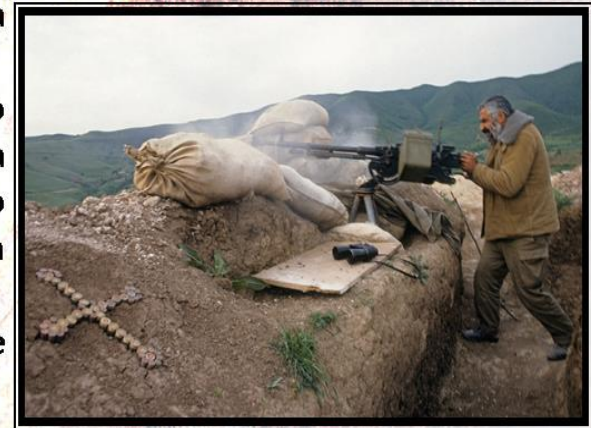
В зоне боевых действий в районе Гадрута, май 1992 года