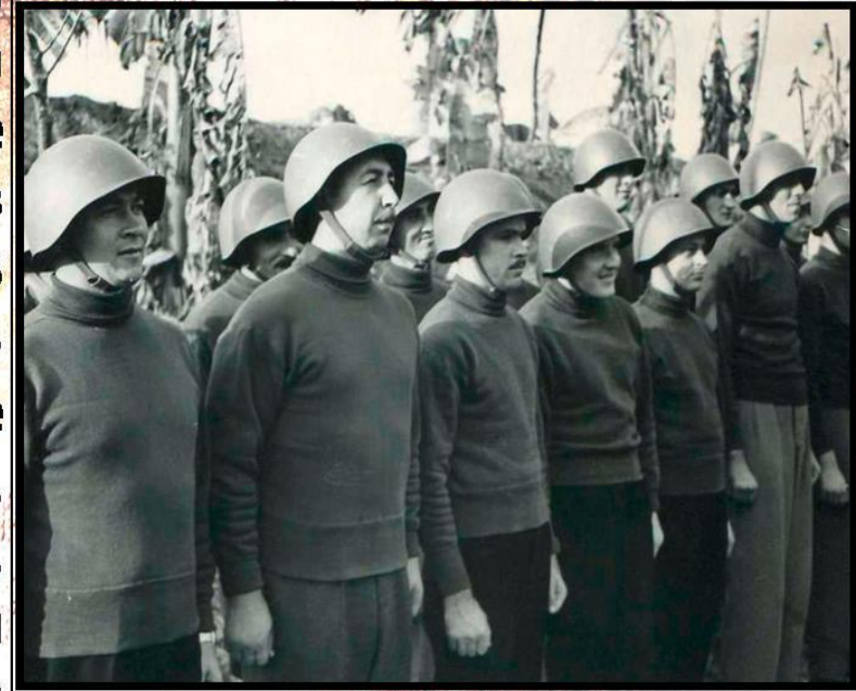
Бойцы и командиры войск ПВО СССР слушают боевую задачу, Ханой, февраль 1966 года

Наши военные также участвовали и во Вьетнамской войне 1965-1974 годов. Тогда Советский Союз выступал на стороне Северного Вьетнама, выступая против оккупации страны американскими силами. В помощь корейскому народу помимо военно-технических грузов отправились советские военные специалисты – зенитчики, артиллеристы, связисты, моряки, медики, летный состав. За время военных действий при поддержке советских специалистов прошло более 450 воздушных боёв. Всего в войне приняли участие более 6000 советских военных, потери составили 16 человек.