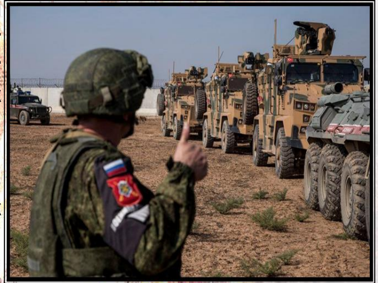
Вооруженные силы РФ в Сирии

К концу прошлого года правительственные войска с помощью российских военных практически полностью зачистили от боевиков территорию Сирии.