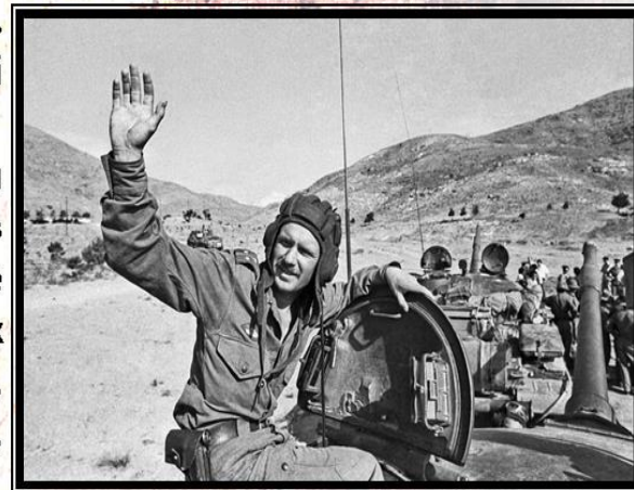
Кабул. Вывод советских воинских частей из Афганистана

Много горя, бед и страданий принесли нашему народу эти девять лет и пятьдесят один день жестоких сражений в чужом краю. Но и там, в далёком Афганистане, советские воины проявили лучшие человеческие качества: мужество, стойкость, благородство. В невероятно трудных условиях боевой жизни, вдали от дома, ежечасно подвергаясь опасности, и подчас смертельной, они сохранили верность военной присяге, воинскому и человеческому долгу.