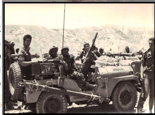
Израильская разведка из подразделения «Шайкет» на Синае во время шестидневной войны. 1967

Кроме того, российские войска находились в Анголе, Мозамбике, Йемене и Лаосе во время местных гражданских войн, участвовали в пакистано-индийском конфликте 1971 года, прибыли на территорию Чехословакии для оказания интернациональной помощи» в соответствии с требованиями Варшавского договора в 1968 году.