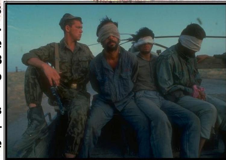
Таджикистан. Российские бойцы конвоируют пленных боевиков таджикской оппозиции