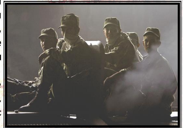
Российские военные в Южной Осетии, август 2008 года