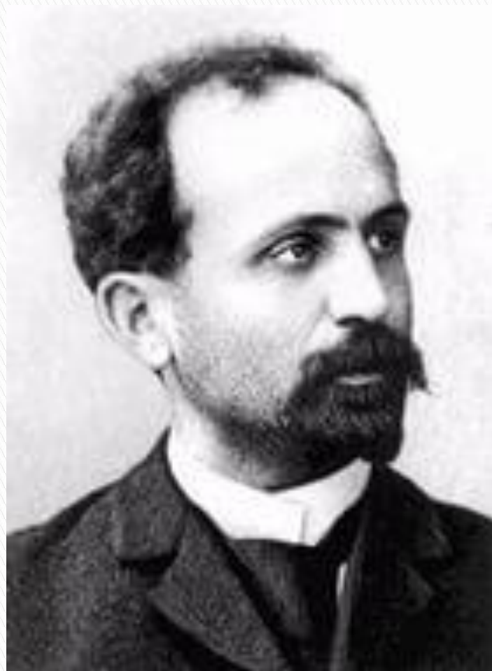
Г.И. Россолимо ( 1860-1928)

□ Григорий Иванович Россолимо (1860-1928), известный невропатолог, в начале века предложил свой оригинальный метод, который получил название "метод психологических профилей", по которому в отличие от европейских психометрических методик предлагалось исследовать восемь основных способностей ребенка: стойкость памяти, быстроту запоминания, толкование рисунков, обнаружение нелепостей, способность комбинировать, состояние моторики, воображение, наблюдательность.