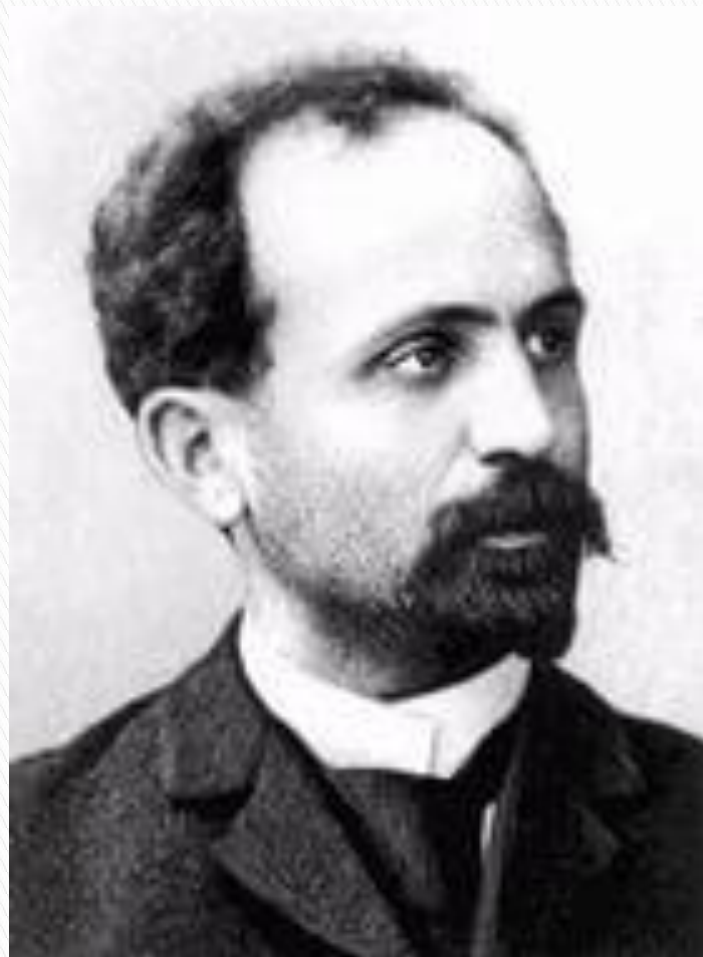
Г.И. Россолимо ( 1860-1928)

□ Григорий Иванович Россолимо (1860-1928), известный невропатолог, в начале века предложил свой оригинальный метод, который получил название "метод психологических профилей", по которому в отличие от европейских психометрических методик предлагалось исследовать восемь основных способностей ребенка: стойкость памяти, быстроту запоминания, толкование рисунков, обнаружение нелепостей, способность комбинировать, состояние моторики, воображение, наблюдательность.