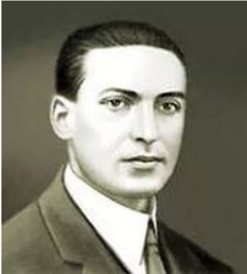
Л.С. Выготский (1896-1934)