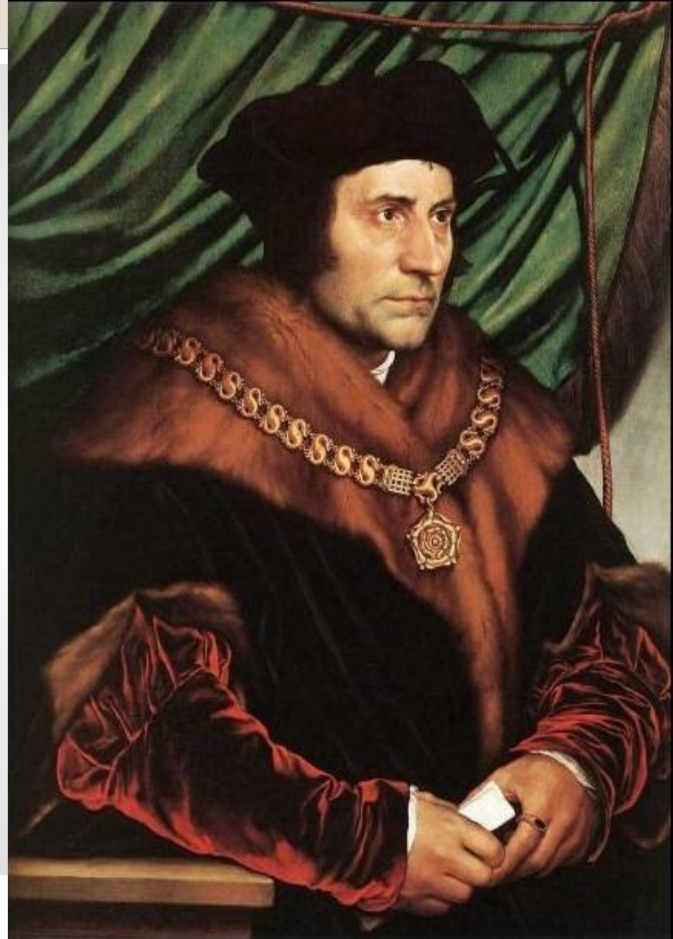
Портрет сэра Томаса Мора. 1527. (Гольбейн Ганс Младший)

Первые утопии. Томас Мор «Золотая книга, столь же полезная, как и приятная, о наилучшем устройстве государства и о новом острове Утопия»