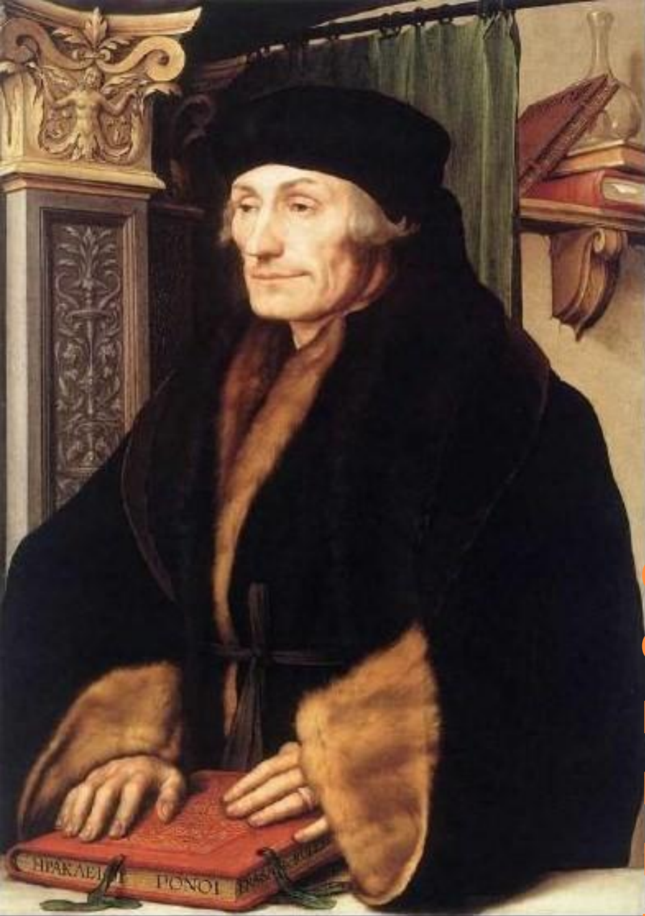
Портрет Эразма Роттердамского. 1523. (Гольбейн Ганс Младший)