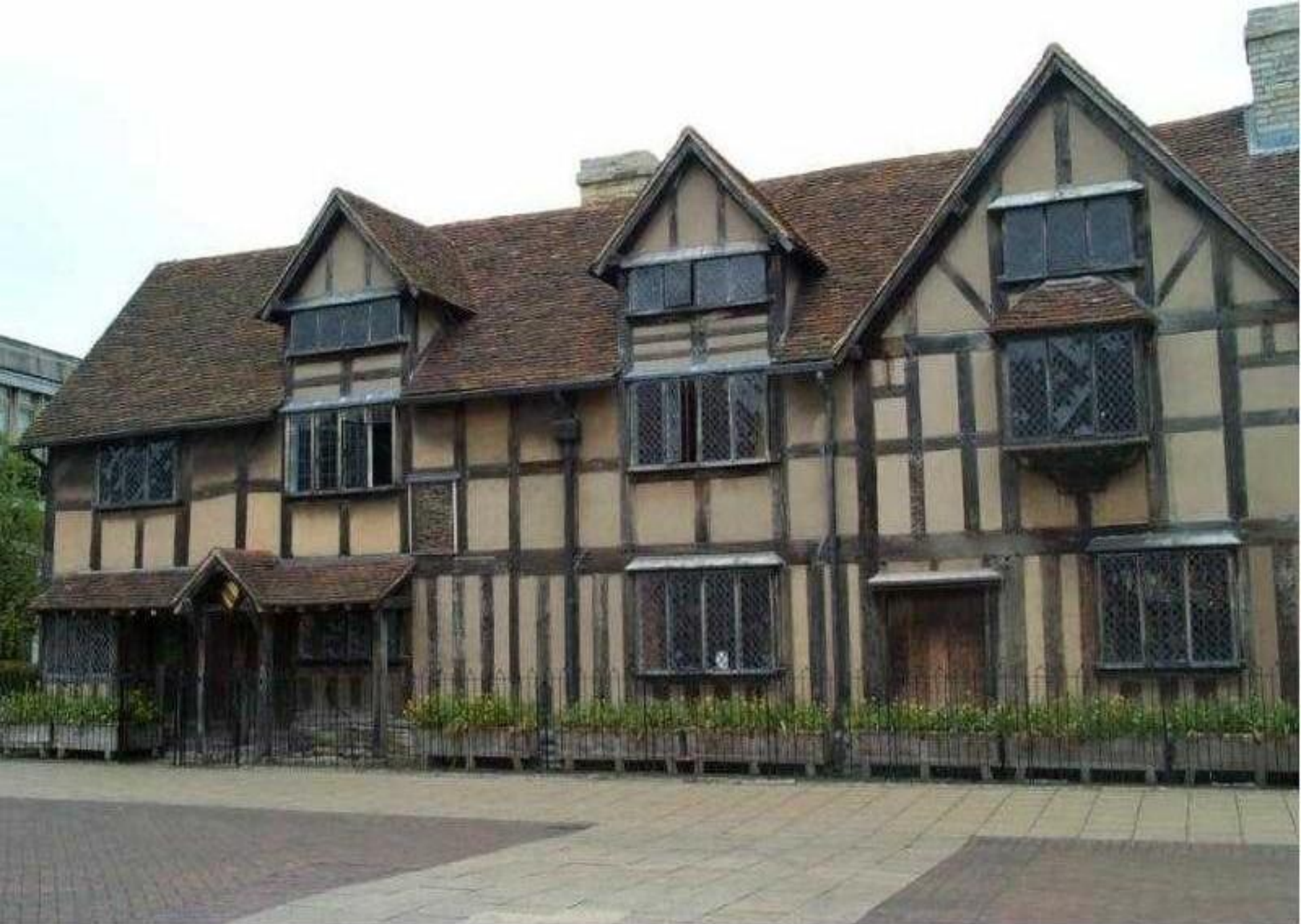
Дом, в котором родился Шекспир. Стратфорд-на-Эйвоне. Англия.