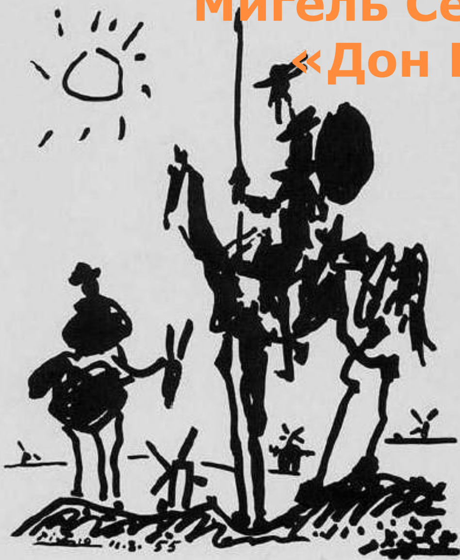
Дон Кихот и Санчо Пансо