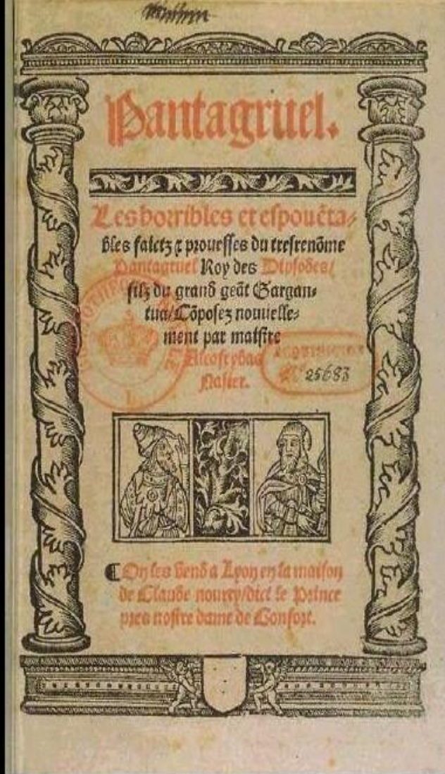
Титульный лист издания романа Ф. Рабле "Гаргантюа и Пантагрюэль". Лион. 1532